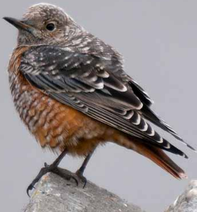
Stendrossel, Nordby, Fanø, 12. oktober 2010.