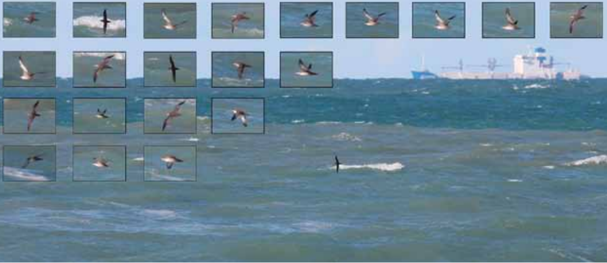
Balearskråpe, Hirtshals, 17. september 2010.

Pågældende fugl var tidligere på dagen observeret og meldt ud fra Kullen i Sverige, hvor den forsvandt ved 15-tiden (Svalan.se 2011). Den blev efterfølgende eftersøgt og observeret fra de nævnte nordsjællandske kystlokaliteter mellem kl. 18.00 og kl. 21.00. Bemærk, at to fund fra januar 1993 nu regnes som værende af samme fugl, hvorfor opsummeringen af de danske fund er ændret. Disse to fund er 23/1 1993, Korshage, Rørvig (S), trk. og 25/1 1993, Gilleje (S). Månedsfordelingen af de danske fund er: januar (4), august (2), september (5) og oktober (3). (Sydatlanten, overvintrer i den nordvestlige del af Nordatlanten)