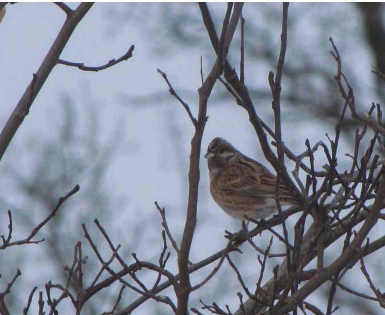
Hvidkindet Værling, Skovbakken, Aabenraa, 1. februar 2010.

Arten blev ikke set i Danmark i 2010, hvilket var første gang siden 2003. (Nordfinland og Nordrusland; overvintrer Kina og Sydøstasien)