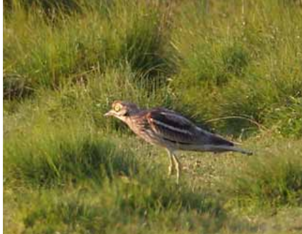
Triel, Borreby Mose, 31. juli 2010.

Arten er med undtagelse af 2008 set hvert år siden 1998. (Mellem- og Sydeuropa; overvintrer i tropisk Afrika)