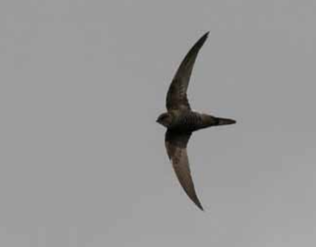
Orientsejler, Vestamager, 15. juni 2010.