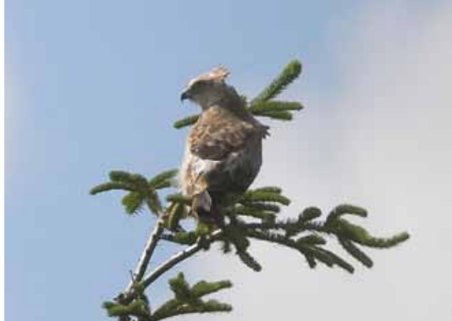
Slangeørn, Harrild Hede, 25. juni 2010.