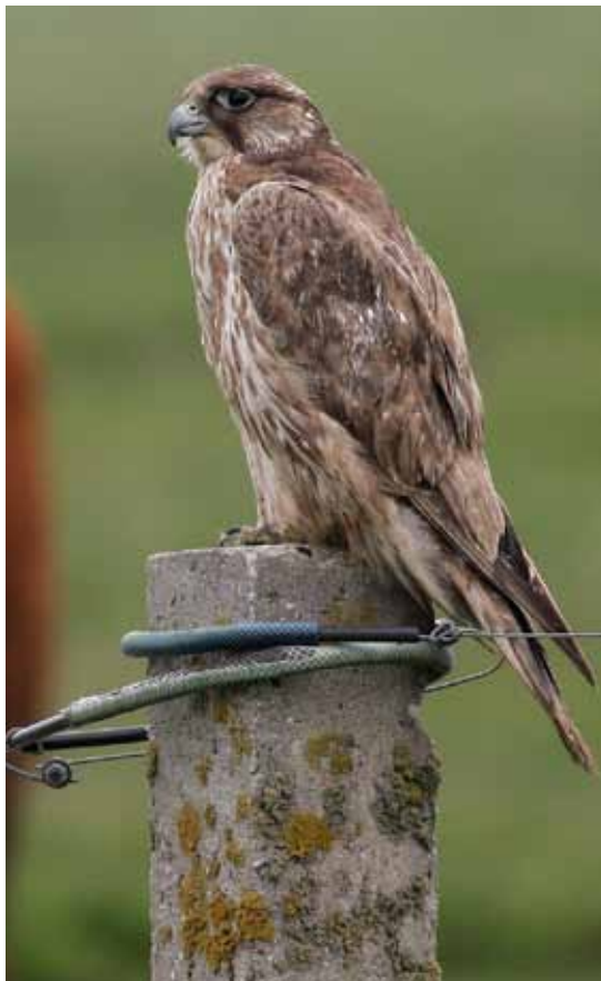
Jagtfalk, Bygholm Vejde, 8. juni 2010.

På fotos af den udfarvede fugl fra 2010 har det været muligt at konstatere en gul farvering med sort inskription om højre tarse. Den har herefter kunnet spores til et fransk Høgeørne-projekt, hvor man følger den sydøstfranske ynglebestand på ca. 30 par ved hjælp af bl.a. ringmærkning (Aigledebonelli 2011). Her har man bekræftet, at det drejer sig om en af deres mærkede Høgeørne samt, at det er en vild fugl. På denne bag-