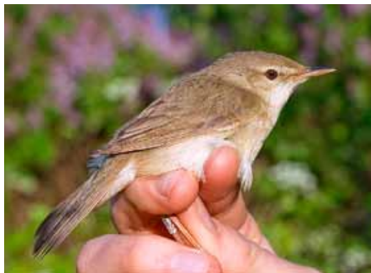
Buskrørsanger, Gedser Fuglestation, 2. juni 2010.