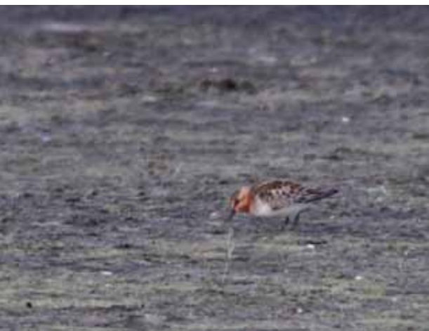
Rødhalset Ryle, Grenen, 11. august 2010.

2007: 25-31/5, Margrethe Kog og Vidåslusen (SJ), ad.