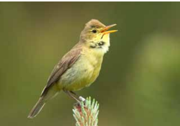
Spottesanger, Blåvand, 8. juni 2010.

Hermed 10. fund for Christiansø. Fundet er det tidligste efterårsfund i Danmark, og heller ikke i Sverige (54 fund t.o.m. 2010) er der fund af arten så tidligt på efteråret, hvor tidligste efterårsfund er 2/10 2006 i Norrbotten (Nya Svenska fågellisten 2011). Sverige havde et fund af arten i 2010; 11-13/12 i Malmø (Kryssalett 2011). (Altai og Tien Shan; overvintrer Nepal og Indien)