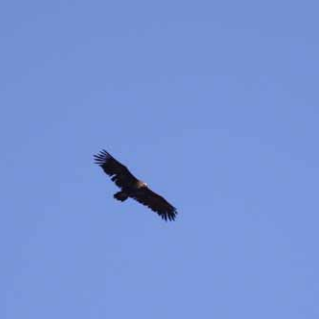
Munkegrib, Tvorup Plantage, Thy, 3. oktober 2010.