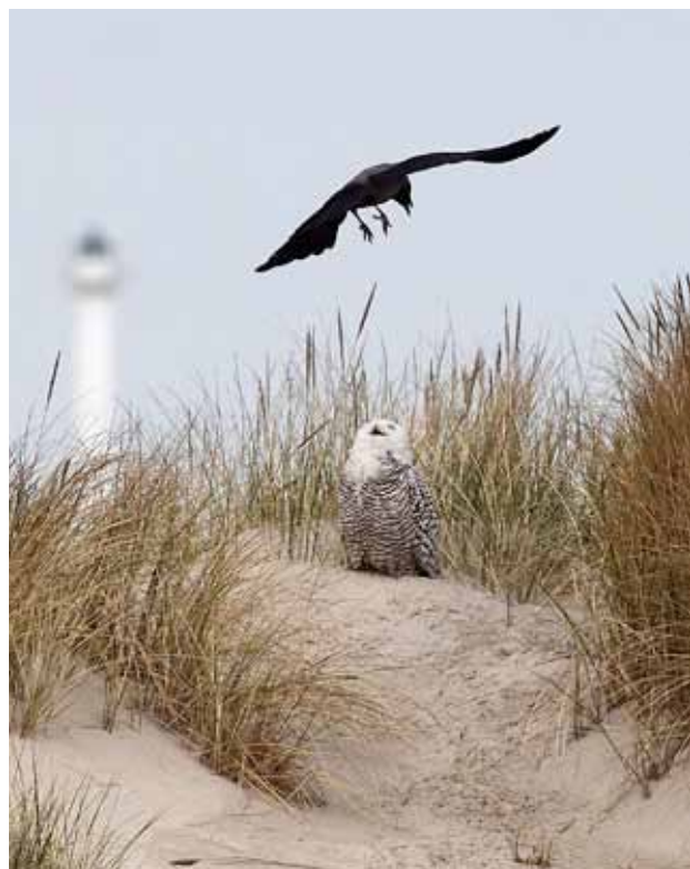
Sneugle, Grenen, 18. Maj 2010.

2010: 18-19/5, Skagen (NJ), 2K hun, *Rolf Christensen m.fl. (Foto). (Nordskandinavien, arktisk Rusland og Canada)