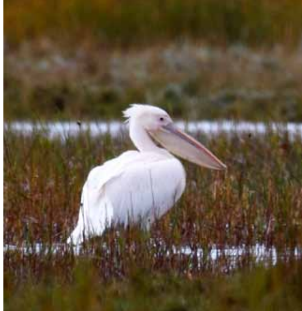
Hvid Pelikan, Bløden, Læsø, 18. september 2010.