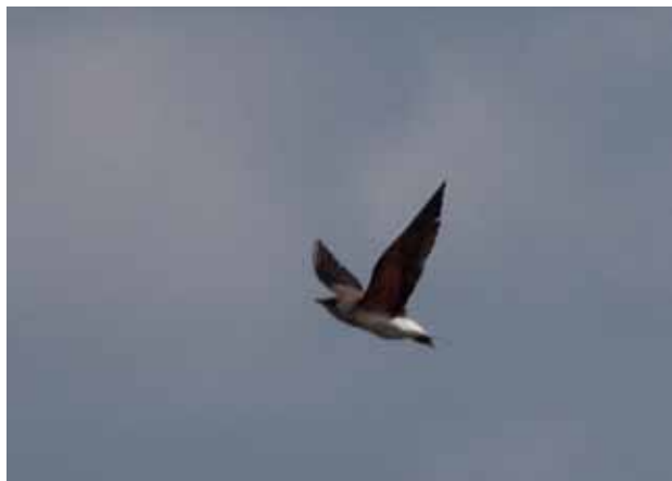
Orientbraksvale, Vest Stadil Fjord, 26. maj 2010.

Første danske fund af denne asiatiske vadefugleart. Fuglen rastede ret stedfast på lokaliteten en god del af dagen, indtil den om eftermiddagen forsvandt mod