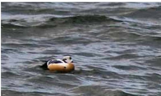
Øverst t.v.: Sort Ibis, Nørresø, Tønder, 29. april 2010.