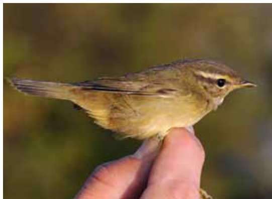
Schwarz Løvsanger, Christiansø, 10. oktober 2010.