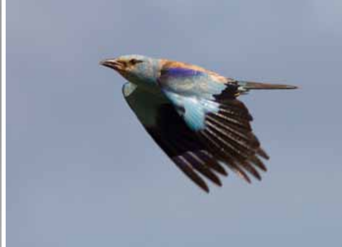
Ellekrage, Gadeby, Bornholm, 20. August 2010.