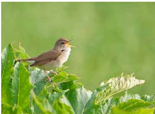
Buskrørsanger, Vindbyholt, Sjælland, 14. juni 2010.