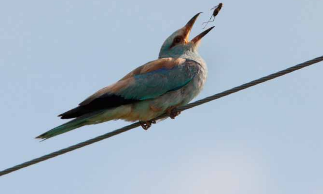
Ellekrage, Gadeby, Bornholm, 20. August 2010.

f.eks. fund af almindelige burfugle (Undulat m.fl.). Er man i tvivl om, hvorvidt et fund bør behandles af SU, kan man kontakte udvalget.