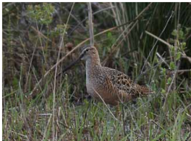
Langnæbbet Sneppeklire, Lille Vildmose, 4. maj 2010.

2010: 8/7, 2K+, Saltvandssøen, Margrethe Kog (SJ), *Tim Andersen, Erik Kramshøj, Jørgen Hulbæk