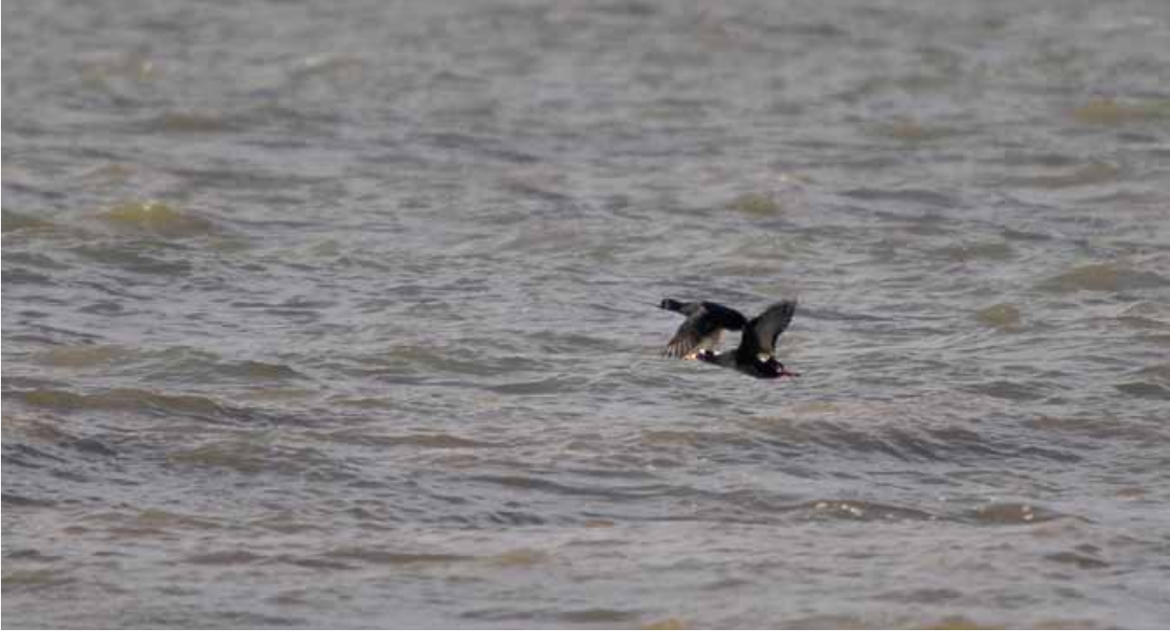
Brilleand med Sortand, Blåvands Huk, 17. oktober 2010.