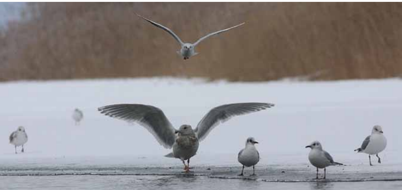
Gråvinget Måge, Brabrand Sø, 17. februar 2010.

Christiansen. – 8/8, Stege Bugt ud for Stege Sukkerfabriks Jordbassiner (M), *Finn Jensen. – 19-30/9, Firtals Strand, Odense Fjord (F), *Ole Bent Olesen m.fl. (Foto). Fundet fra Saltvandssøen regnes som et tilbagevendende individ, idet arten sås på samme lokalitet både i juli 2008 og 2009 (Kristensen et al. 2008, Kristensen et al. 2009). Fundene fra Saltvandssøen i 2009 og 2010 indgår derfor ikke i opsummeringen. Fundet fra Firtals Strand er det hidtil seneste fund i Danmark. (Finland, Hviderusland og Rusland; overvintrer tropisk Afrika, kysterne langs Det Indiske Ocean, Sydøstasien og Australien)