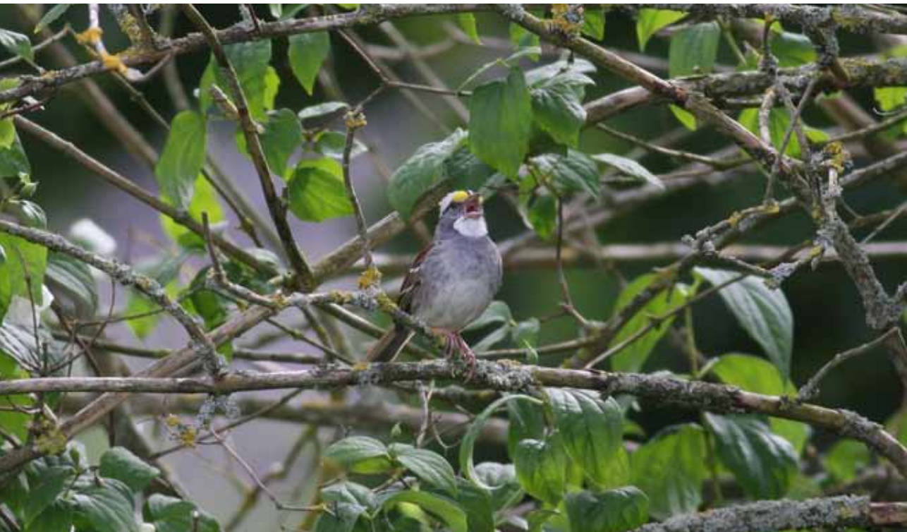
Hvidstrubet Spurv, Skørping, 5. juli 2010.

2010: 22/6-18/7, Skørping (NJ), han syng., *Chris Stilling, Rasmus Strack, Hans Christophersen m.fl. (Foto). Andet danske fund af denne nordamerikanske småfugl; første er fra Kongelunden, Amager (S), 23/5 1976 (Hansen 1976). Fundet i 2010 falder fint i tråd med en rekordstor forekomst af arten i foråret 2010 på de Britiske Øer, hvor ca. 12 fugle sås i perioden 29/4 til 19/6 (Rare Bird Alert 2011). Det er sandsynligt, at flere af disse fugle (inklusiv den danske) er ankommet med skib over Atlanterhavet, hvilket følgende observation vidner om: fem Hvidstrubede Spurve opholdt sig på krydstogtskibet Queen Mary II 29/4 2010, da det sejlede ud fra New York. Fire fugle var stadig ombord, da skibet nåede britisk territorialfarvand vest for Scilly-øerne 5/5, og én opholdt sig fortsat på skibet 6/5, da det ankom til Southampton Dock, Hampshire, sydkysten af England (Birding World 2010). Hvidstrubet Spurv er en af de almindeligste amerikanske spurvefugle på de Britiske Øer med 34 fund t.o.m. 2007 (Slack 2009). Sjældenhedsudvalget har besluttet at godkende iagttagelsen som en spontan forekomst (kategori A), da fuglen var fin i fjerdragten og ikke havde skader på næb og kløer, som det ofte er tilfældet ved fugle, der har været lukket inde i et bur. Fugle, der ankommer med skib til Danmark, godkendes i kategori A, medmindre det er konstateret, at de er blevet fodret (eller tilbudt vand) eller har været tilbageholdt i bur,