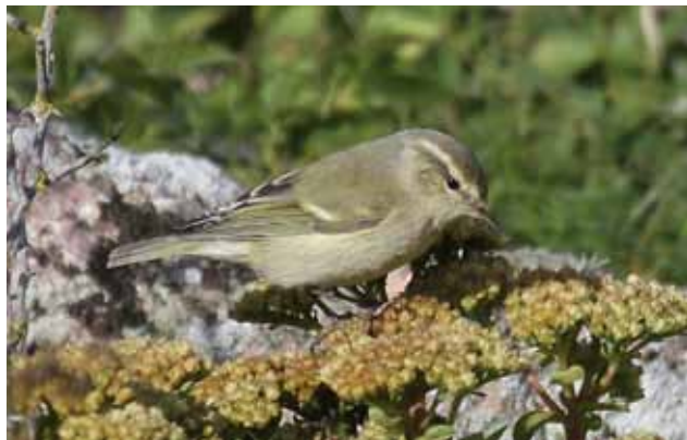
Himalayasanger, Christiansø, 30. September 2010.