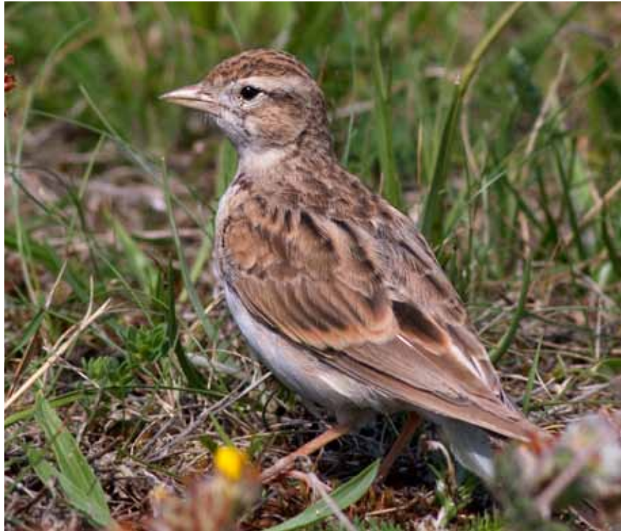
Korttået Lærke, Harboøre Tange, 8. juni 2010.

Arten var en længe ventet gæst, da sidste godkendte danske fund af arten er 18-25/5 1997, Østmøn (M)