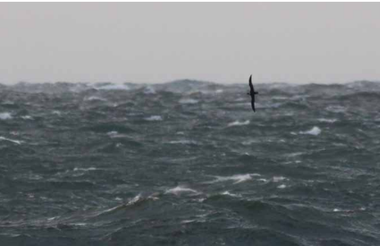
Storskråpe, Tisvildeleje, 25. august 2010.