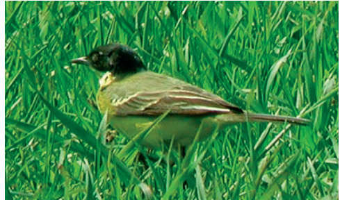
Sorthovedet Gul Vipstjert, 2K ♂, Skagen 19/5 2002.

2001: 16.10, Tipperne (RK), 1K, *Ole Amstrup. Landets tredje fund på fire år. Som det var tilfældet med landets to første fund, blev også denne fugl opdaget fra en kørende bil! (Mongoliet; overvintrer i Indien og Sri Lanka)