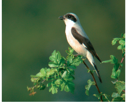
Rosenbrystet Tornskade, Porsemosen, Ballerup 31/7 2002. Lesser Grey Shrike.