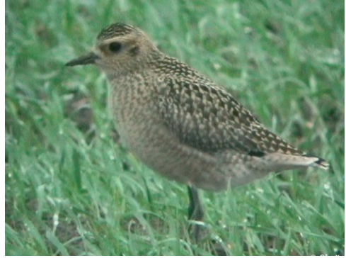
Sibirisk Tundrahjelle 1K, Raghhammer Odde, Bornholm 14/10 2002. Pacific Golden Plover

Fuglen rastede i længere tid på den tyske side af grænsen i Rickelsbüller Koog. Ved en enkelt lejlighed sås den flyve over grænsen til Margrethekog, hvorfor den