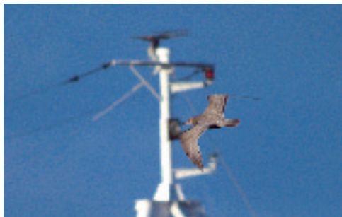
Thayers Måge (2K), Hanstholm Havn 19/2 2002. Thayer's Gull.