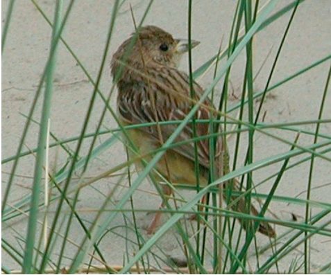
Brunhovedet Værbling/Hætteværbling, 1K+ ♀, Hønen, Fanø 7/9 2002. Red-headed or Black-headed Bunting.