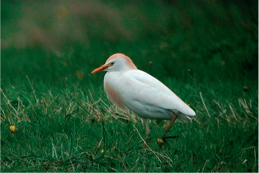
Adult Kohejre, Haurvig, Hvide Sande 25/4 2002. Cattle Egret.