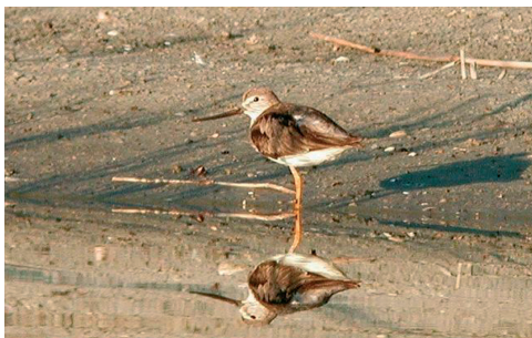
Terekklire, Rærup, Vodskov 8/6 2002. Terek Sandpiper.

Ny art for landet. Der var tale om den samme fugl begge steder. Fundet er nærmere behandlet af P.H. Kristensen (2002). Det danske SU følger AERC TACs (Taxonomi Advisory Committee of the Association of European Rarities Committees) taxonomiske anbefalinger, men TAC har endnu ikke behandlet en eventuel opsplitning af Hvidvinget Måge Larus glaucooides . Ved amerikanske arter, som TAC ikke har behandlet, følges i stedet American Ornithologists' Union's officielle amerikanske liste ( www.aou.org/aou/birdlist.html ), og her er Thayers Måge opført som en selvstændig art. (Nordvestlige Canada)