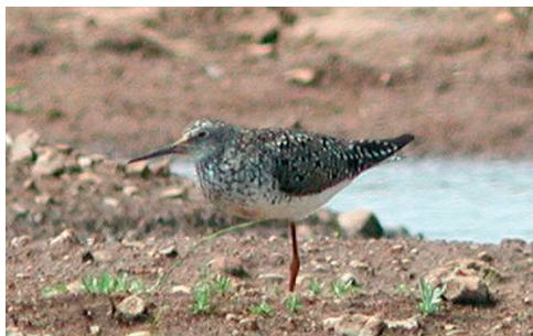
Lille Gulbenet Klire, Skjern Enge 3/6 2002. Lesser Yellowlegs.

2002: 8-9.6, Rærup, Vodskov (NJ), *Anton Thøger Larsen m.fl. (Foto). – 26-27.7, Måde Enge, Esbjerg (RB), *Jens Thalund, Per Poulsen m.fl. via Ole Amstrup (Foto).