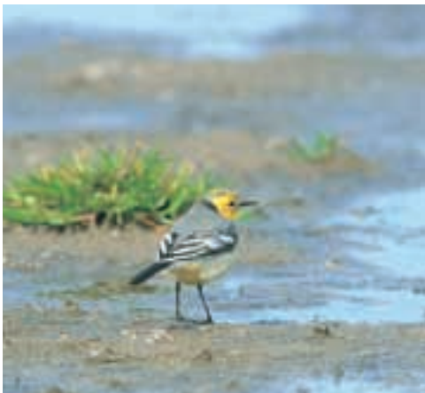
Citronvipstjert 2K ♂, Værnengene 1/5 2001. Citrine Wagtail.

Landets andet fund af Gråsejler og den første fugl observeret og bestemt i felten. Arten var hidtil blot repræsenteret med en dødfunden fugl 11/3 1993 Kirke Helsing (S) (Nielsen & Thorup 2001, Thorup 2001). Den aktuelle fugl dukkede op i forbindelse med en relativ varm luftstrøm fra det sydvestlige Middelhav og udgør det nordligste fund under en invasion til Nordvesteuropa i oktober 2001. Således havde Storbritannien 9 fund 2-31/10 (Colin Bradshaw i brev) og Nordfrankrig 1 eks. 20/10 og 24/10 (Phillippe J. Dubois i brev).