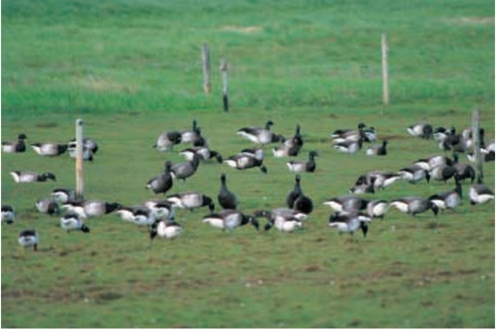
Sortbuget Knortegås ad., Agerø 16/5 2001 (fuglen i midten) i flok med Lysbugede og Mørkbugede Knortegæs.

Black Brant (center) with Dark-bellied and Light-bellied Brent Geese.