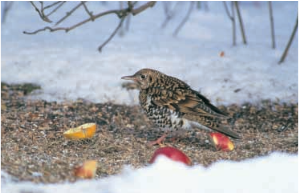
Gulddrossel 2K, Skårup, Øsløs 5/3 2001. White's Thrush.

Fuglen frekventerede en foderplads i en have under en kuldeperiode med snedække og forsvandt igen, da vejret slog om og sneen smeltede. Arten indleder forårstrækket i marts og ankommer til yngleområderne i maj, hvorfor det aktuelle fund må betragtes som en vinterforekomst. Alle hidtidige fund er af ældre dato: 10/4 1909 Liselund (M), 2/1 1918 Sjørring (NJ) og 13/10 1952 Nørresundby (NJ) (Salomonsen 1963, Rasmussen 1999). Med nu to vinterfund og ét fra hver træksæson adskiller forekomsten herhjemme sig fra billedet i det øvrige Nordvesteuropa, hvor efterårsfund dominerer. Blandt andet har Sverige 6 fund september-november 1837-1985 (Risberg 1990) og Finland 3 fund 29/9-5/10 1961-1999 ( www.birdlife.fi ). (Sibirien mod vest til Ural; overvintrer Indien og Sydøstasien)