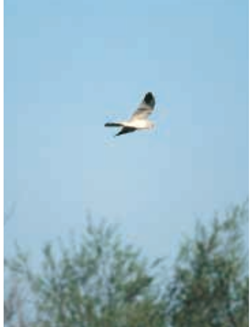
Steppehøg 3K+ ♂, Rejsby Enge 12/5 2001.