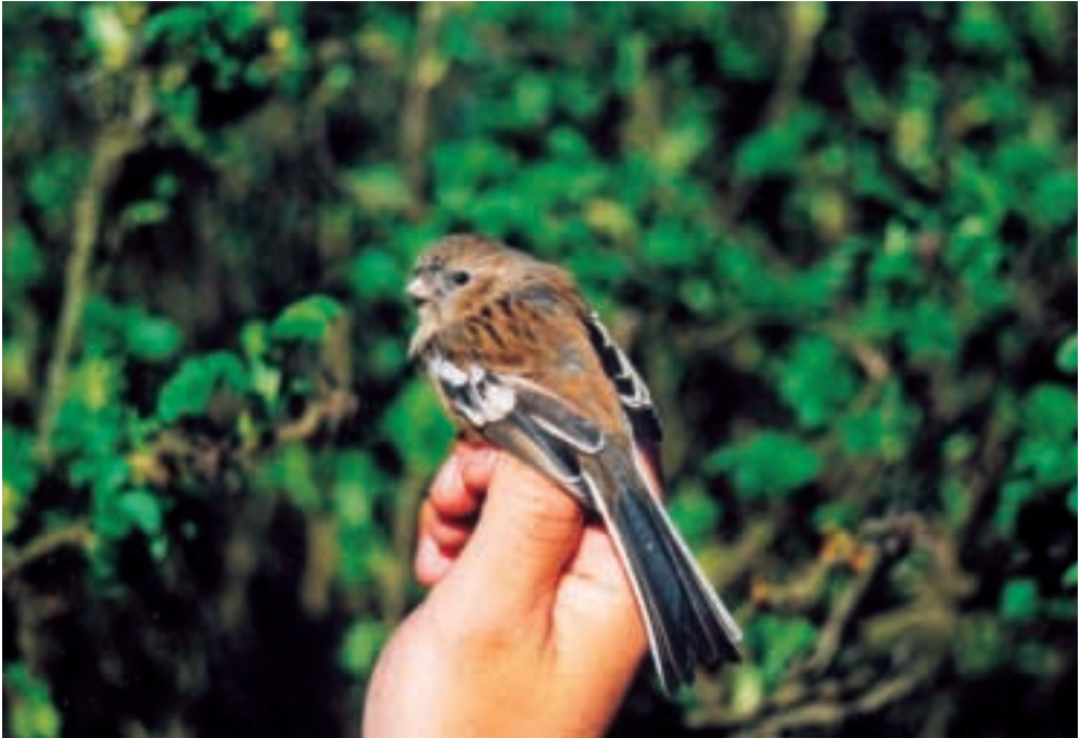
Langhalet Karmindompap 2K+ ♀, Blåvand 11/5 2001. Long-tailed Rosefinch.

Krumnæbbet Ryle Calidris ferruginea 2001: 6.12, Vester Vedsted Sluse (RB), *Michael Schwalbe.