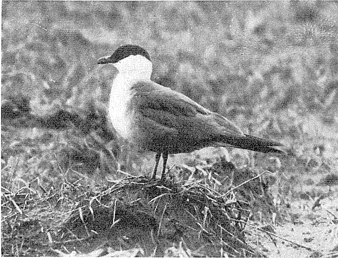
Fig. 3. Lille Kjove ( Stercorarius longicaudus) 13.-14. 11.1969, Vester Vedsted. Mangler de forlængede halefjer.