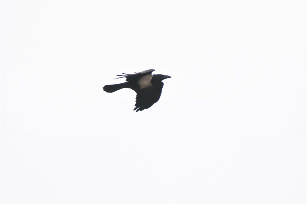
Broget krage, 27. marts 2022, Hammeren.