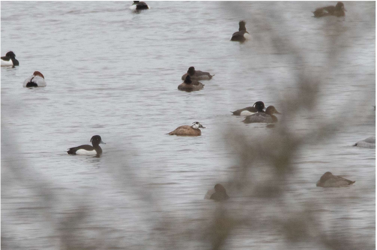
Hvidhovedet skarveand, Selsø.