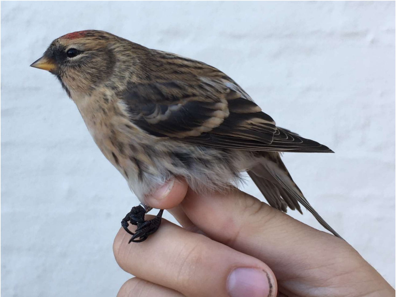
Stor Gråsisken ssp. rostrata , Skagen 14. oktober 2018. Ny race for landet.