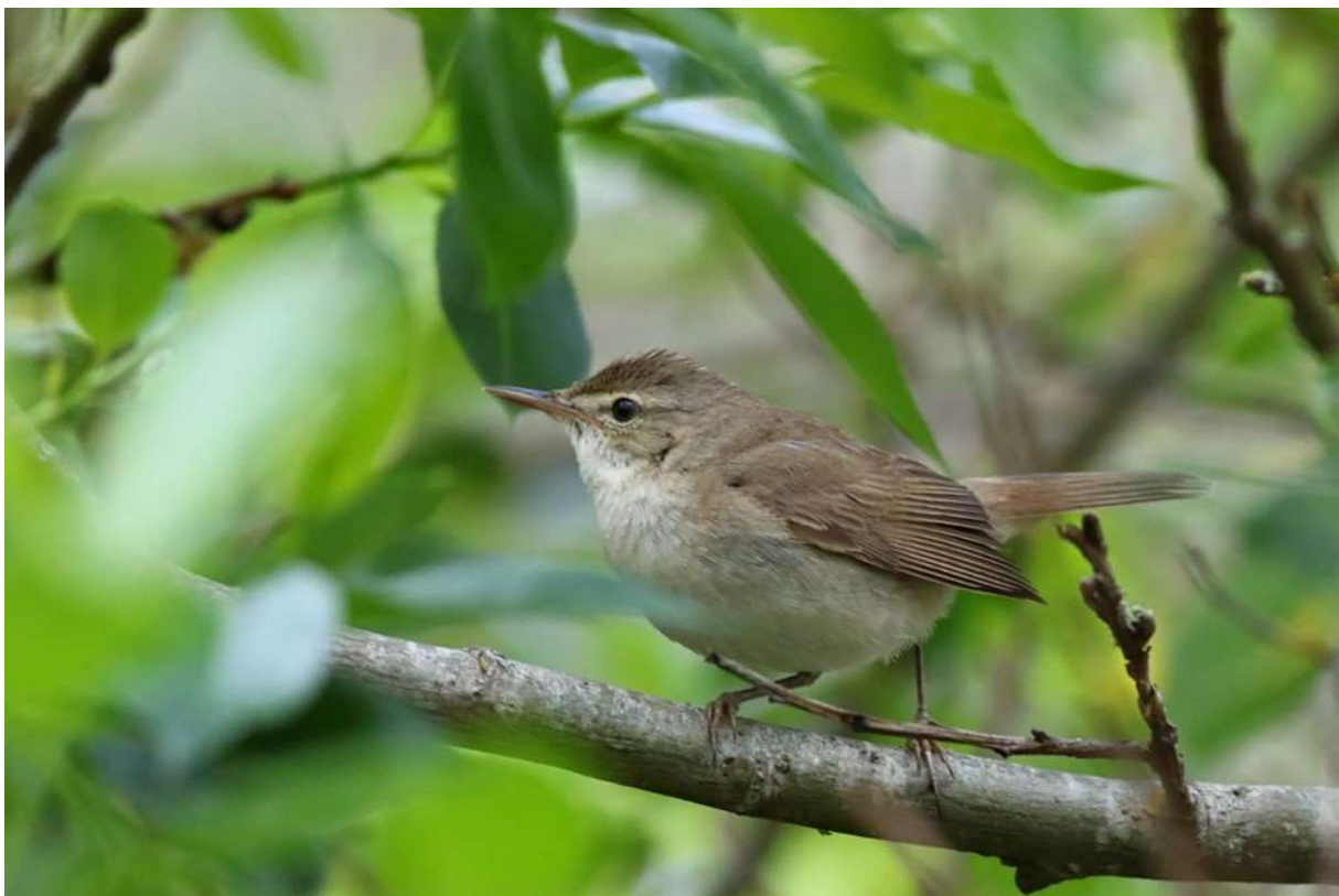
Buskrørsanger, Skagen, 7. juni 2020 (fra Netfugls galleri).