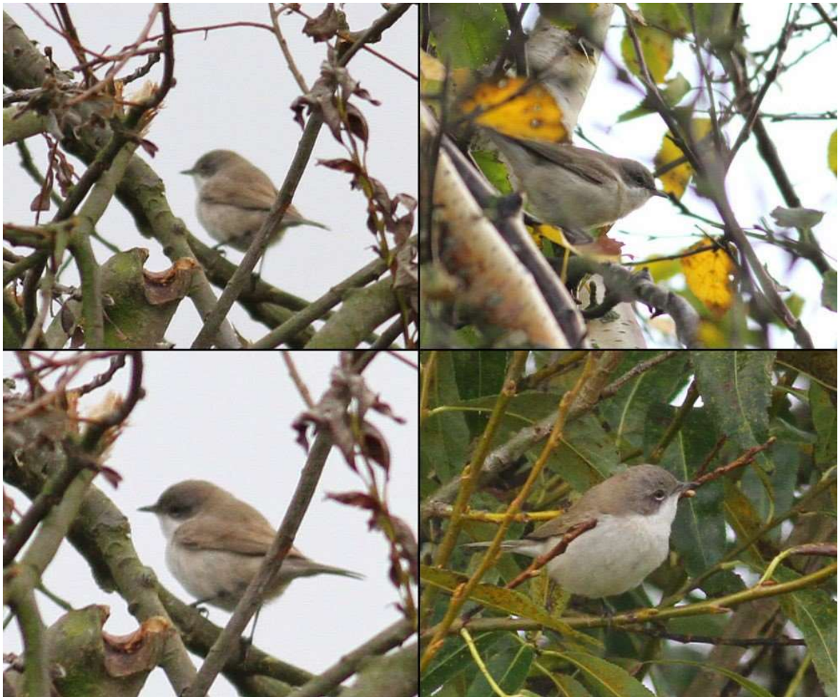
Gærdesanger ssp. halimodendri/blythi, Mandø, 5. oktober 2014.

trækgæst. Desuden foreligger der fund af to østlige racer; ssp. blythi (4 fund) og ssp. halimodendri (3 fund) samt ikke-racebestemte blythi/halimodendri (5 fund). På baggrund af overlap mellem karakterer hos de to østlige racer er Sjældenhedsudvalgets foreløbige tilgang, at godkendelse til race skal baseres på DNA. Både ssp. blythi og ssp. halimodendri kan kalde med karakteristiske "rullende" kald, som afviger fra ssp. curruca , hvorfor fund af ssp. blythi/halimodendri , 'østlig gærdesanger', kan godkendes uden DNA, hvis der foreligger lydoptagelser og/eller fotos og beskrivelse af kaldet. I den forbindelse er dokumentation af særligt ydre halefjer, oversidens farve (inklusive nakke/isse) samt svingfjerenes indbyrdes længde vigtige karakterer. Observatører og ringmærkere opfordres til at indsamle prøver til DNA-analyse på sene gærdesangere, så vi kan få bedre indblik i, hvor hyppigt de to østlige racer hver især optræder i landet.