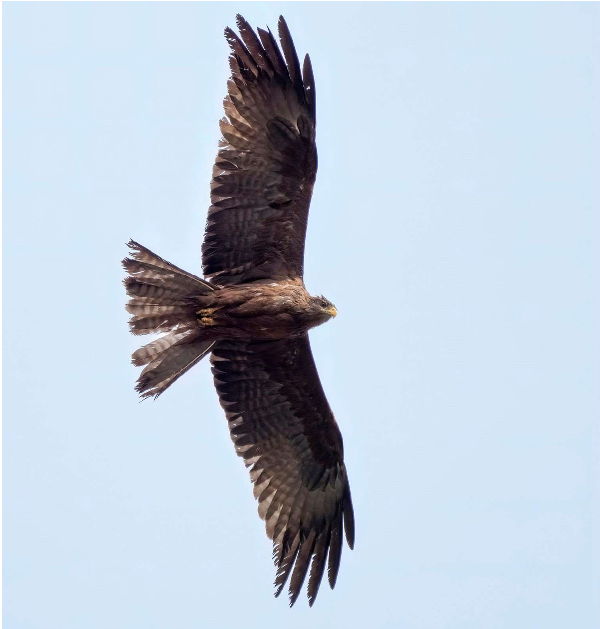
Gulnæbbet glente 3K+ ssp. parasitus, Skagen, 3. maj 2021.

Kanariske Øer (se link hér ), der regnes som værende en spontan forekomst, ligesom der er fund i Marokko. Har du kendskab til gulnæbbet glentes status som fangenskabsfugl i Europa eller fund af arten i Europa, hører Sjældenhedsudvalget meget gerne om det. Fuglen havde slidte hale- og svingfjer, men fuglen viste ingen sikre tegn på at have haft en fortid i fangenskab. En gennemgang af fotos af gulnæbbede glenter fra artens udbredelsesområde syd for Sahara viser, at nogle individer kan have en lignende slidt dragt. Sjældenhedsudvalget er endnu ikke kommet frem til en afgørelse om kategorisering af fundet.