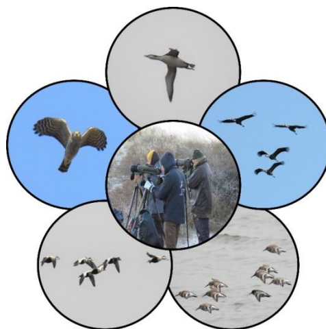
Figur 1. Logo for Danske Trækobservatører.

IHS: VU vil igen i 2023 afholde Fuglefagligt Symposium, og udvalget kan også overveje at afholde endnu en skrive-weekend, hvis der er ønske om det. VU har en pulje på 25.000 kr. pr. år til uddeling til faglige projekter, som også kan være på/fra fuglestationerne.