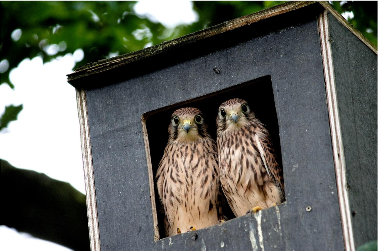
Tårnfalk.