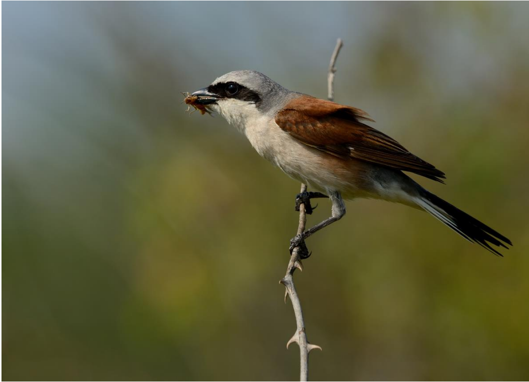
Rødrygget tornskade med friskfanget føde.

Husk at du stadig kan gå de sene TimeTælleTure! Sidste dag er den 22. juni.