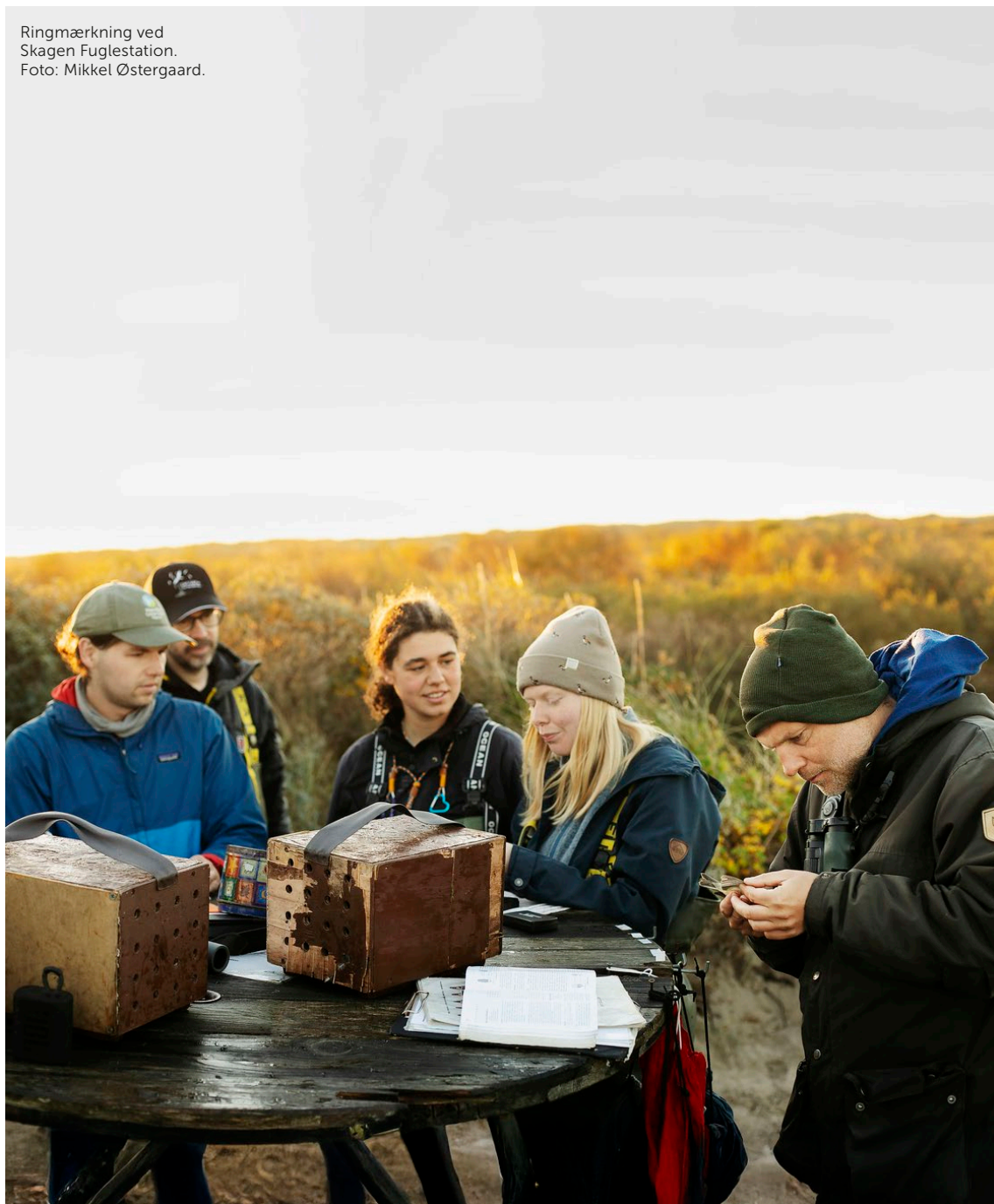
Ringmærkning ved Skagen Fuglestation.