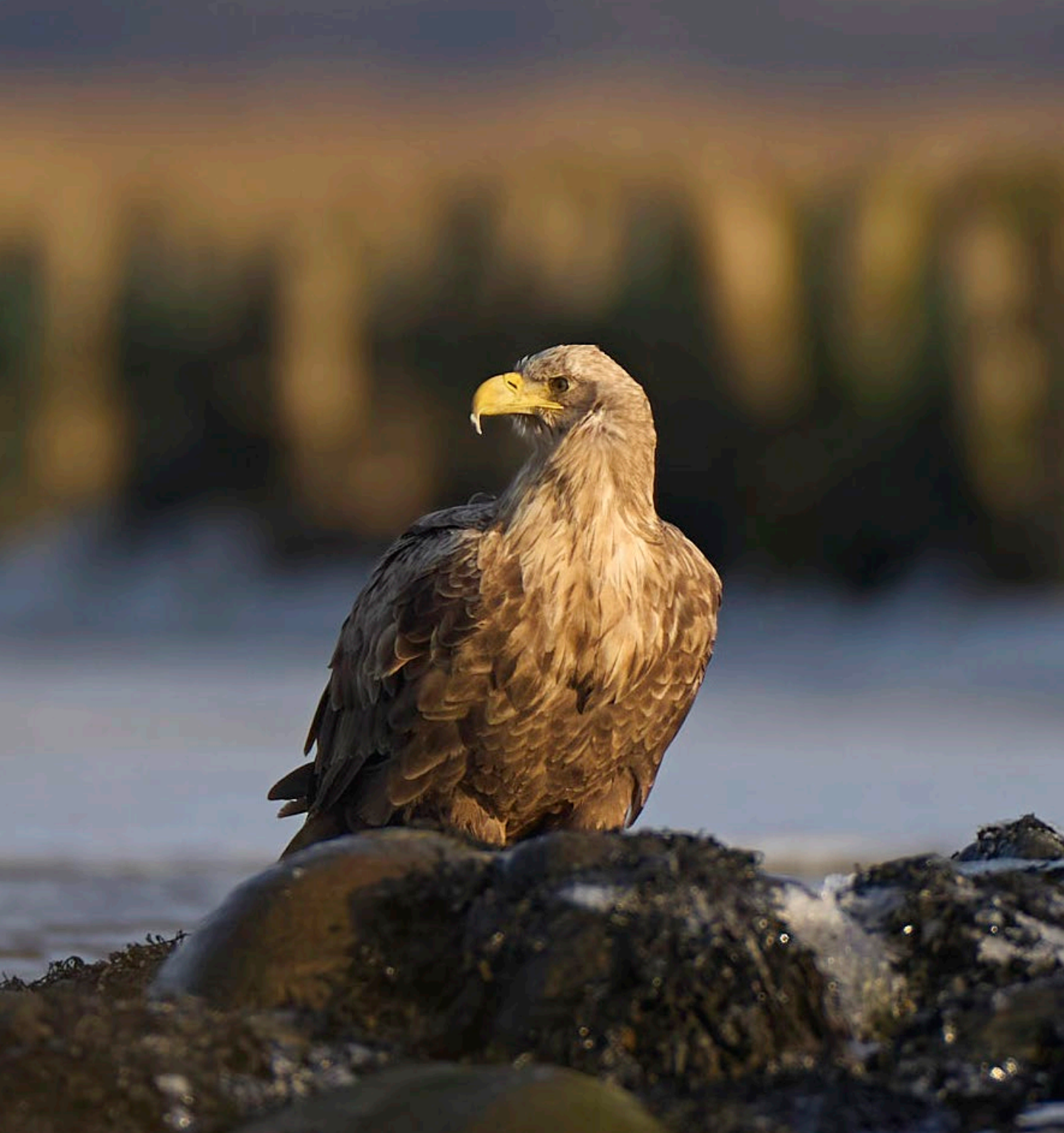
Havørn.