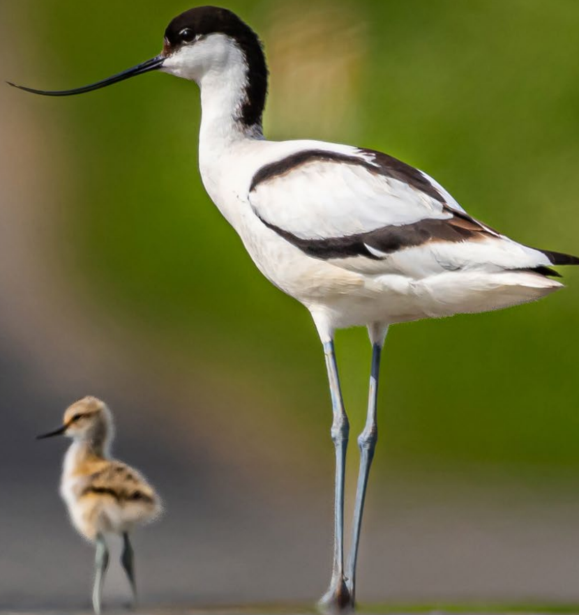
Klyde, Borreby Mose.