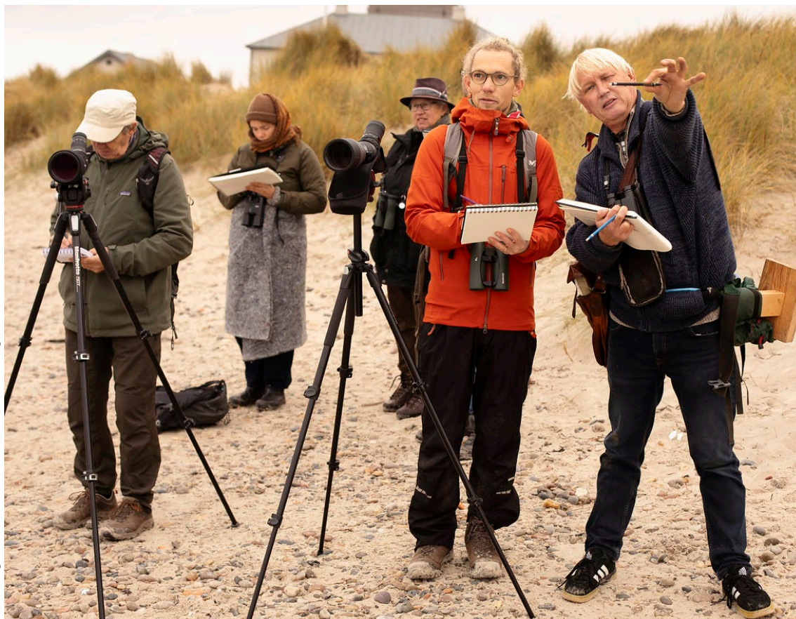
DOF's fugleambassadører.

DOF's tre store fuglestationer i Gedser, Blåvand og Skagen har igen haft god søgning fra mange frivillige, især fra udlandet, og de har medvirket til at indsamle værdifulde data