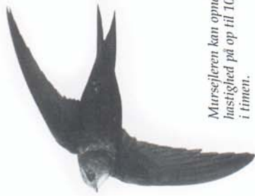
Mursejleren kan opnå en hastighed på op til 100 km i timen.

Mursejleren minder meget om svalerne, men er af en helt anden fuglefamilie.