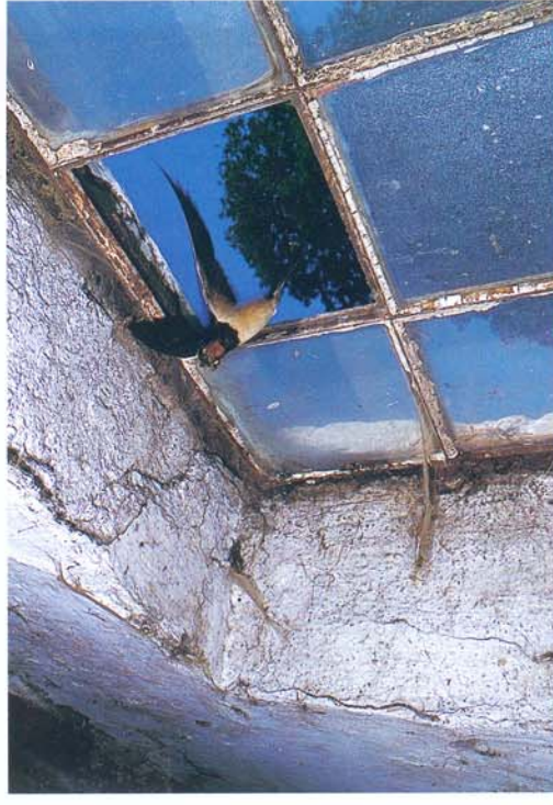
Her har en venlig landmand holdt vinduet åbent for landsvalen, der er på vej med mad til ungerne. Svalerfamilien har brug for 9.000 insekter om dagen.

Få fugle optræder så hyppigt i den danske folketro som svalerne, der tidligere betragtedes som lykkebringere. Med deres tilknytning og deres trofasthed overfor det gamle redested, hed det, at hvis en landsvale flyttede til en anden gård, flyttede lykken med svalen. Gjorde man svalerne fortræd i yngletiden, kunne alskens ulykker ske: Dødsfald eller anden ulykke kunne ramme husets beboere, kreaturerne døde eller blev syge, eller gården blev ramt af lynnedslag. En forklaring på opfattelsen af svalerne som en velsignelse for gården og bibringerne af lykke og fremgang, kan være den, at svalerne bosatte sig ved de huse, der i forvejen "var lykke ved", nemlig de velhavende gårde med stort husdyrhold, hvor redemulighederne og fødeudbuddet var stort.