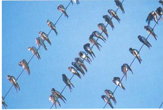
Digesvaler samlet før trækket med syd. Her som "noder" på ledningerne.

Træk: Overvintrer i Afrika syd for Sahara og ned i Centralafrika. Ankommer til Danmark som den sidste af svalerne. De første i midten af april, flertallet i sidste halvdel af maj.