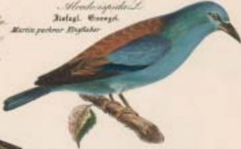
Corvus garrulus L. Elskrage. Mandelkøbe. Ruller. Røller