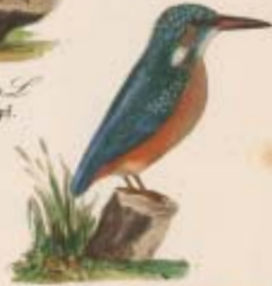
Alcedo esculenta L. Isflug. Gøngefl. Kortis pølsar. Dylfløder