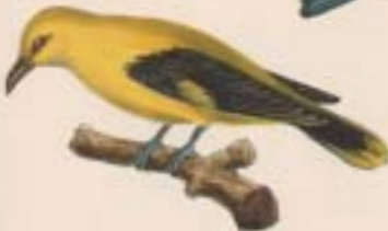
C. Pust. Guldpuæl. Guld-Hest. Lorret. Hælved.