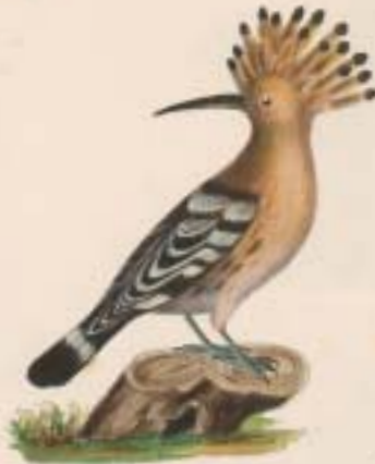
Uropus alpestris L. Hærflug. Wiedehopf. Kappe. Kappes

Uropus Hærflug. Wiedehopf. H. Alcedo Isflug. Gøngefl. H. Alcyon Vieder. Viesentrost. H. Corvus Elskrage. Mandelkøbe. H. C. Pust.