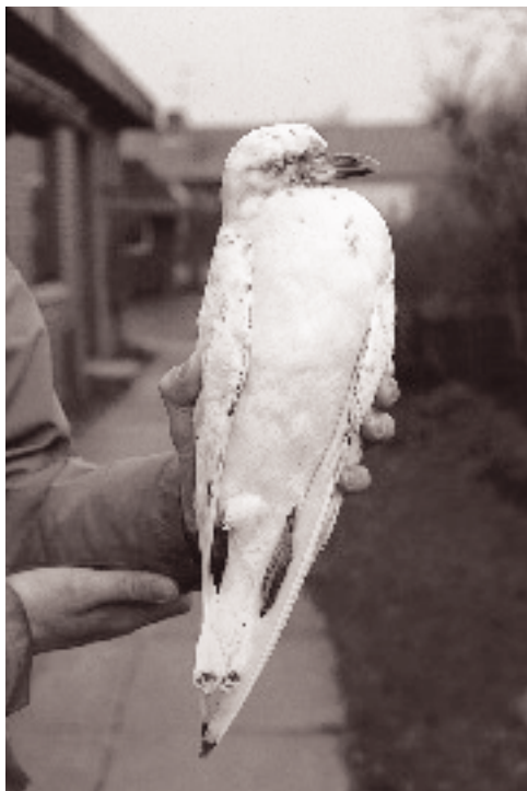
Ismåge 2K, Nissum Fjord 7. januar 1994.

De fire tidligere fund er fra 1894, 1956, 1958 og 1960 (Olsen 1992). Kun fuglen fra 1894 blev oprindelig bestemt til Langnæbbet Sneppeklire (Salomonsen 1963), mens de tre øvrige har været omtalt som ubestemte sneppeklirer af Salomonsen (1963) og Dybbro (1978) og først er angivet til art i Olsen (1989).