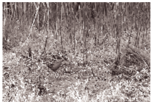
Dværgrørvagtel, Kærup Holme, Vejlerne 4. juni 1988.

Første danske fund af denne nordamerikanske art er fra 1933, mens de syv efterfølgende alle er fra perioden 1975-1985. Det nye fund er det tredje fra Tipperne. Fordelingen af de tidligere fund er maj 1, juni 1, august 3, september 2 og oktober 1.