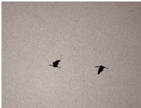
Sort Ibis, Fjordholme, Limfjorden 22. oktober 1994.

Fire fund er ret normalt for de seneste år. Frem til 1980 optrådte arten kun uregelmæssigt herhjemme, mens der siden årligt har været 1-6 fund. En tilsvarende udvikling er bemærket i Holland (Berg 1995). Flere aflæsninger af halsbåndsmærkede individer antyder, at den hyppigere optræden til dels skyldes udsætningsprojekter i Sverige siden 1979 og i Finland siden 1989.