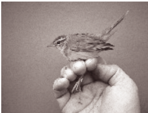
Schwarz Løvsanger 1K, Christiansø 9. oktober 1994.

Fuglen fra Nordøstsjælland sås begge dage ved redehul sammen med en Broget Fluesnapper Ficedula hypoleuca hun. Ved to senere besøg på lokaliteten var fuglene ikke at finde. Blandingspar mellem Hvidhalset Flue-