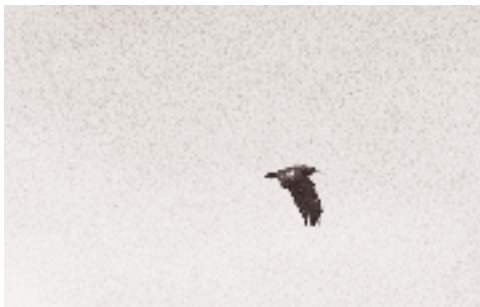
Lille Skrikeørn imm., Stevns Klint 14. september 1994.

De første danske fund af denne nordamerikanske art, som er truffet adskillige gange i Europa, blandt andet i Sverige, Norge og Finland (Alström et al. 1991). Arten er imidlertid almindelig i fangenskab, og europæiske fund regnes generelt ikke som spontane. De to danske fund må ligeledes betragtes som undslupne fangenskabsfugle; den første var mærket med både farvering og metalring, mens den anden var meget tam og lod sig fodre med brød.