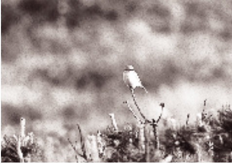
Isabellatornskade ad. ♀, Totten, Anholt 9. juni 1994.

især oktober, med kun enkelte fund fra foråret (Alström et al. 1991).