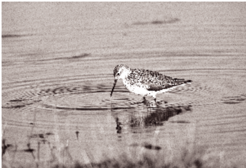
Damklire ad. i sommerdragt, Borreby Mose 12. maj 1994.