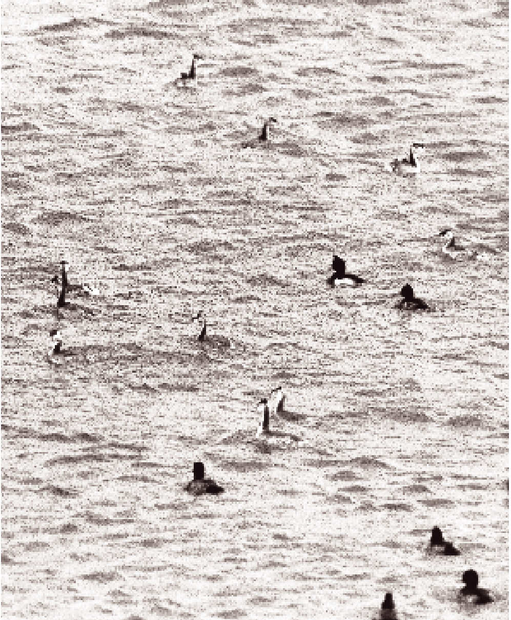
De fleste danske Toppede Lappedykkere overvintrer formentlig omkring Kanalen, som disse fugle i IJsselmeer i Holland, men en del trækker mod sydøst til Sortehavet.

Toppede Lappedykkere opholder sig i saltvand på denne tid af året (og om vinteren), end nærværende materiale lader formode. Som et minimum kan der formentlig sammenlagt raste i størrelsesordenen 8-10000 fugle samtidig i de danske søer og indre farvande om efteråret, men endnu flere passerer formentlig landet i samme periode.