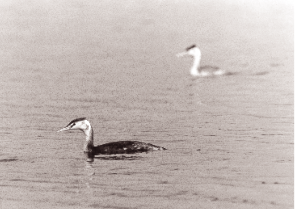
Efter yngletiden samles en stor del af de Toppede Lappedykkere for at fælde i større søer og beskyttede fjorde. Op til 1970 er talt på en enkelt lokalitet i august-september.

1987, hvor der endnu var is på søerne. Men ellers forekommer store antal forårsrastende fugle især på en række af de søer, hvor der også er mange fugle om efteråret (og vinteren).