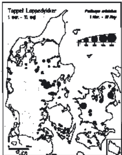
Fig. 4. Maksimumforekomster af Toppede Lappedykkere i Danmark om foråret mellem 1. marts og 10. maj.

Peak numbers of Great Crested Grebes recorded in Denmark during winter, 21 December – 28 (29) February.