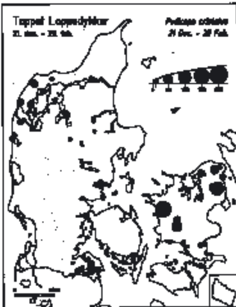
Fig. 3. Maksimumforekomster af Toppede Lappedykkere i Danmark i vintertiden mellem 21. december og 29. februar.

Firs lokaliteter kan opvise forekomster på mindst 50 Toppede Lappedykkere i denne periode (Fig. 2). Af disse var 30 kystlokaliteter. De største registrerede antal var i Hjarbæk Fjord (med den absolutte rekord på 3760 fugle den 29. september 1980), Tårs Vig på Nordøstlolland (1028), Furesøen (880), Tissø (855), Tystrup-Bavelse Sø (610), Mossø (580), Silkeborg Langsø (550), Salten Langsø (510) og ved Vørsø i Horsens Fjord (533). På yderligere 21 lokaliteter (fem i brak- og saltvand) er der talt mere end 200 lappedykkere i denne periode.