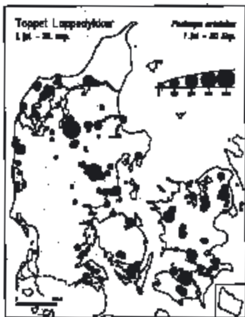
Fig. 1. Maksimumforekomster af Toppede Lappedykkere i Danmark i fældningstiden 1. juli – 20. september. Peak numbers of Great Crested Grebes recorded in Denmark during moult, 1 July – 20 September.

Alle observationer af mindst 50 Toppede Lappedykkere er tillige opstillet i 10-dagesperioder. På grund af materialets heterogenitet (oftest tilfældige observationer) er det ikke anvendeligt til egentlige fænologiske opstillinger. Men for at få mulighed for at vurdere det samlede antal fugle på de forskellige årstider er de gennemsnitlige maksimumtal for hver 10-dagesperiode summeret over hhv. ferskvandslokaliteter (incl. nogle få svagt brakke inddigede lokaliteter) og saltvands/brakvandsområder (herefter oftest kaldet kystlokaliteter). Bemærk at forekomster på under 50 fugle ikke tæller med i gennemsnittene. Grunden til, at der gennemgående er anvendt maksimumtal i dette arbejde, er at Toppede Lappedykkere er vanskelige at registrere, så snart der er bølger på vandet. Derfor er maksimumtal formentlig mest repræsentative for de reelle forekomster.