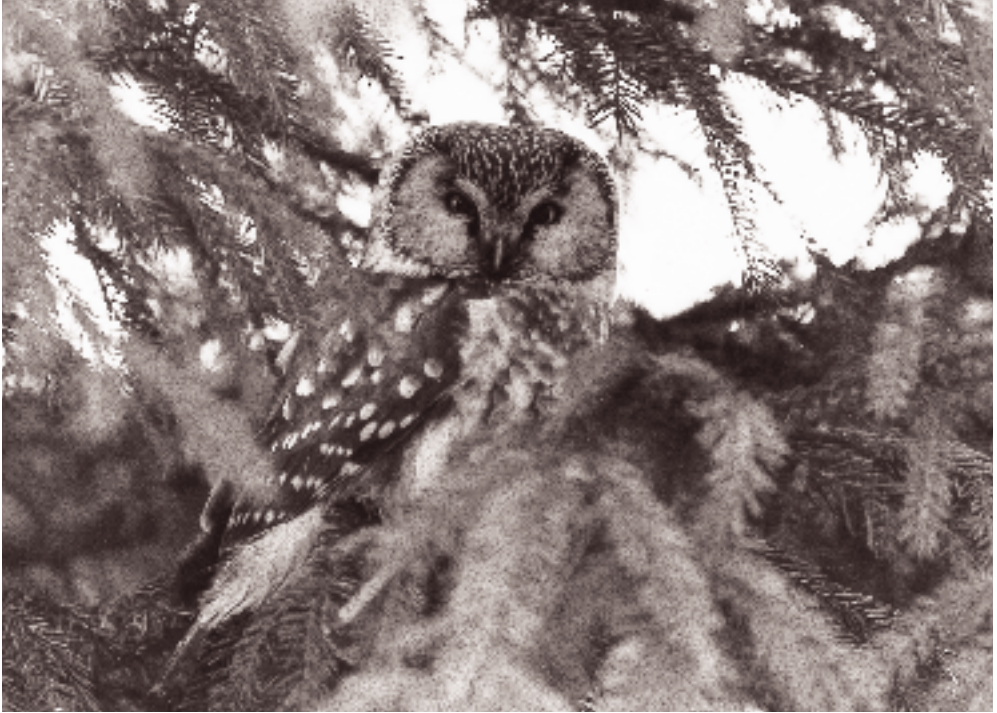
Perleugle i Kongelunden, den eneste regelmæssige overvintringslokalitet i Danmark. De vigtigste byttedyr her er almspidmus, skovmus og markmus.

alle habitater og er på Amager derfor den eneste skovlevende gnaver.