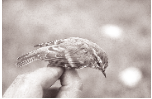
Humes Sanger, Altai, Xingiang, Kina, august 1989.

ne til den nordlige del af Uralbjergene og Pecho-rafloden. Den overvintrer hovedsagligt i Sydøstasien fra det sydøstlige Kina mod vest til det østlige Himalaya (Sikkim) og mod syd til Malaysia (Ticehurst 1938, Williamson 1967) og det nordlige Sumatra (pers. obs.).