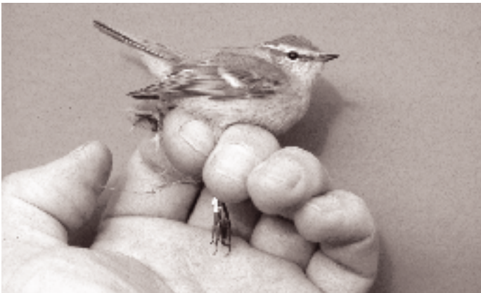
Humes Sanger, Christiansø 27. oktober 1993.

I den følgende gennemgang af, hvordan man bestemmer Humes Sanger og adskiller den fra Hvidbrynet Løvsanger, vil vi tage udgangspunkt i en Humes Sanger fanget på Christiansø d. 27. oktober 1993. Fuglen blev set frem til 31/10, så vi havde rig lejlighed for også at opleve den i felten. Det var et typisk eksemplar i frisk dragt. Derudover har vi gennemgået den relevante litteratur samt undersøgt skindene på Zoologisk Museum i København.