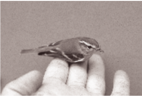
Humes Sanger (Christiansø nov. 1987; øverst t. v.) og to Hvidbrynet Løvsangere (begge Christiansø; nederst t. v. 5. okt. 1993, og til højre 26. sep. 1994).