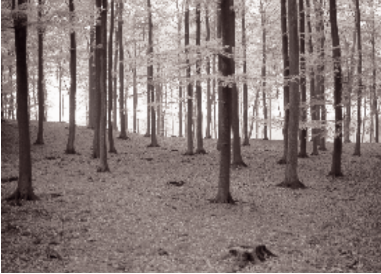
Den danske bøgeskov har været hyldet som stedet, hvor man oplever forårets fuglesang. Men faktisk er bøgesøjlehallen meget fuglefattig.

fuglearter, dobbelt så mange som en homogen og ensaldrende bevoksning. I homogene gran- og bøgebevoksninger optræder blot 7-9 fuglearter nogenlunde hyppigt. Det er især antallet af vegetationslag fra skovbund til trætop, der bestemmer hvor mange og hvilke fugle, der kan leve sammen.