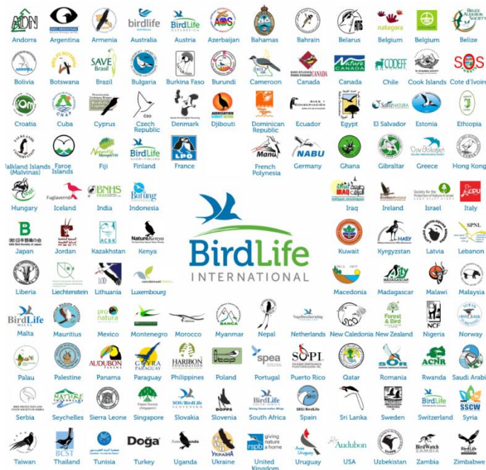
BirdLife partnerskab for natur og mennesker

BirdLife's tilgang til naturbeskyttelse er baseret på troen på, at mennesker, der arbejder for naturen i deres egne lokalområder men er bundet sammen nationalt og internationalt gennem BirdLife partnerskabet, er afgørende for at bevare livet på denne planet. Denne lokal-til-global tilgang sikrer langfristet naturbeskyttelse til gavn for både natur og mennesker.