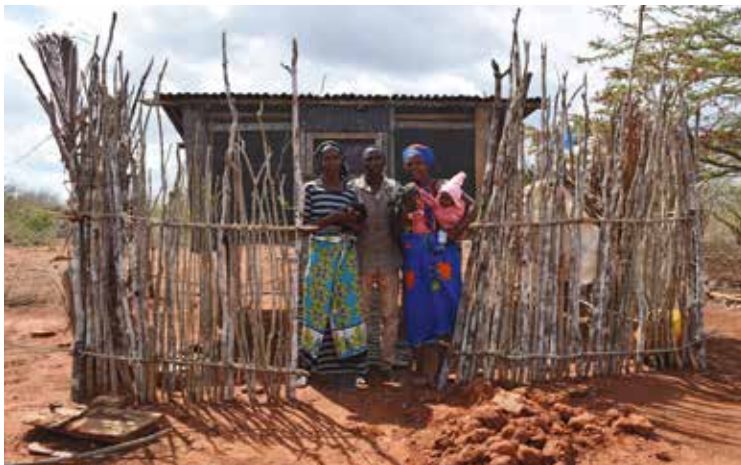
Som alternativ til at inddrage skoven til landbrug tilbydes lokale familier støtte til opdræt af kyllinger.