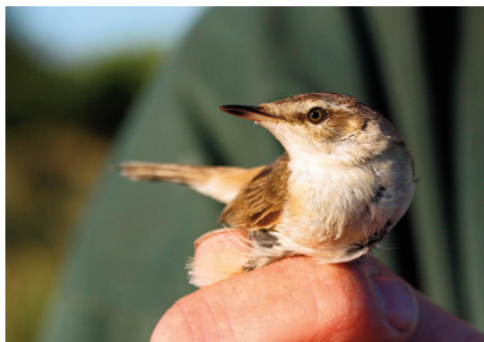
Lille Rørsanger, 2K+, Skagen, 12. juni 2008.

Der er tale om de første fund fra august måned. Der er nu 5 forårsfund (27/5-12/6) og 4 efterårsfund (16/8-17/9). Alle fund omhandler ringmærkede fugle. (Sortehavet til Kaspiske Hav; overvintrer Sydasien.)