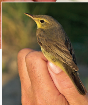
Spottesanger, 1K, Skagen, 18. august 2008.