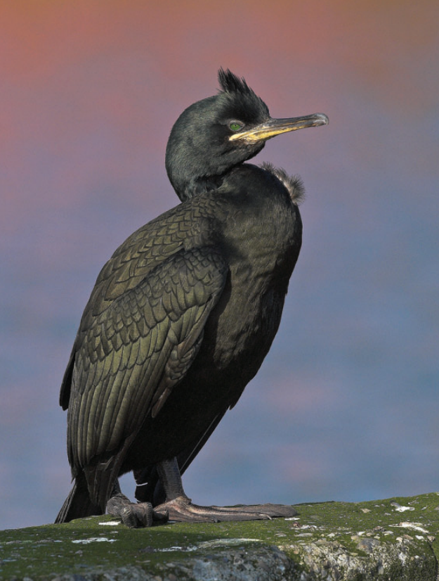
Topskarv, 3K+, Esbjerg Havn, 14. april 2008.