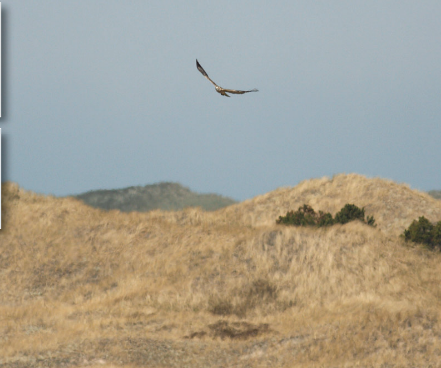
Slangeørn, Hulsig Hede, 5. maj 2008.