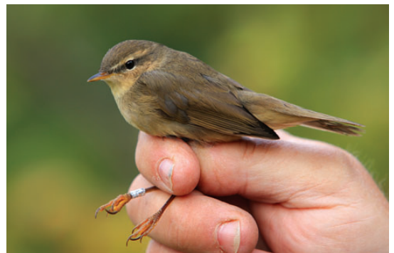
Brun Løvsanger, Blåvand, 30. oktober 2008.