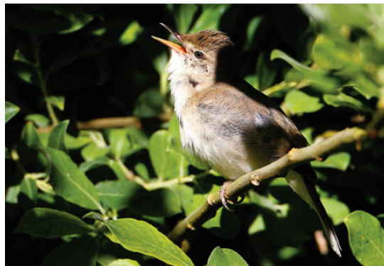
Buskrørsanger, Korup Sø, 21. juni 2008.