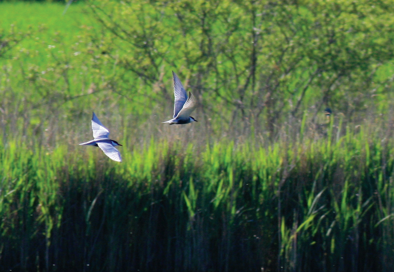
Hvidskægget Terne – udsnit af flok på 6 i alt, Vejlen, Tåsinge, 10. maj 2008.

kjær Lund, *Mogens Ribo Petersen m.fl. (Foto). Første fund siden 12+16/5 1996, ad., Nørreland, Rømø (SJ) (Rasmussen 1997). (Nordamerika)