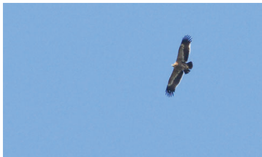
Steppeørn, 2K, 19. maj 2008.