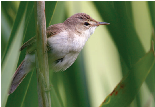
Buskrørsanger, Kalø Vig, 25. juni 2008.

2008: 16/8, Grenen, Skagen (NJ), 1K ringm., *Rolf Christensen m.fl. (Foto). – 18/8, Grenen, Skagen (NJ), 1K ringm., *Rolf Christensen m.fl. (Foto). Meget overraskende forekomst af to ungfugle inden for tre dage på samme lokalitet efter 18 år uden fund af arten. De tidligere fund er begge fra juni måned: 11-22/6 1982, syng. han, Jydelejet (M) og 1/6 1990, ringm., Blåvands Huk (RB) (Boertmann et al. 1986, Frich & Nordbjærg 1992). (Sydeuropa; overvintrer Afrika.)