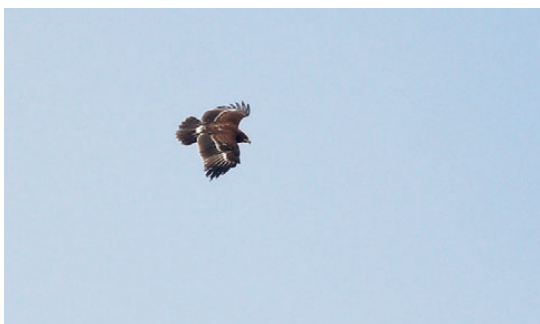
Stor Skrigeørn, 3K, Skagen, 3. maj 2008.