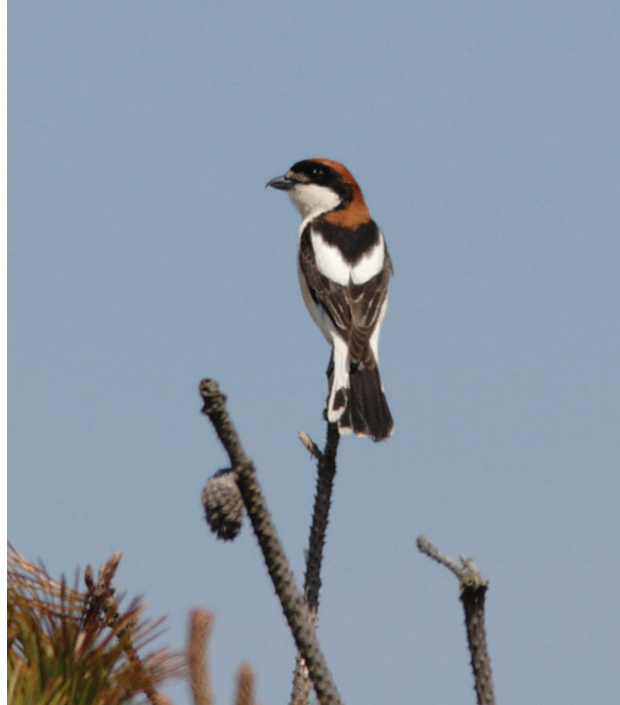
Rødhovedet Tornskade, 2K han, Blåvand, 23. maj 2008.

2008: 23-24/5, Blåvand (RB), 2K han, *Bent Jakobsen, Henrik Knudsen m.fl. (Foto). Første fund siden juni 2003, hvor en fugl sås på Fanø (Amstrup et al. 2004). Seks af de danske fund er gjort i