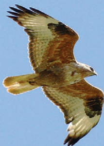
Ørnevåge, adult, Skagen, 28. juni 2008.

(Syd- og Østeuropa; overvintrer nordligt i tropisk Afrika.)