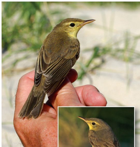
Spottesanger, 1K, Skagen, 16. august 2008.