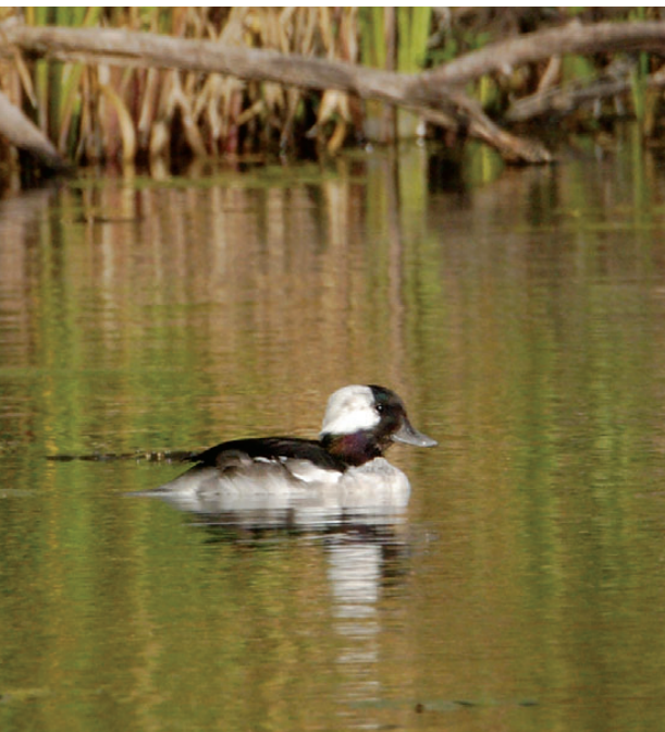
Bøffelend, 2K+, han, Esrum Sø, 2. oktober 2008.

2008: 28/9-6/10, Møllekrog, Esrum Sø (S), 2K+ han, *Troells Melgaard, Jørgen Schultz m.fl. (Foto). Hermed anden iagttagelse af denne lille nordamerikan-