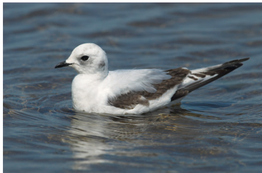
Rosenmåge, 2K, Esbjerg Havn, 1. juni 2008.

De to observationer fra 10/5 drejer sig med stor sikkerhed om samme flok og regnes som ét fund. Der er tale om den største flok, som er set herhjemme. De to observationer fra Fyn og Langeland primo juni regnes ligeledes som ét fund, selvom det ikke kan udelukkes, at der er tale om forskellige fugle. Årets forekomst er den stør-