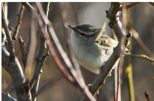
Humes Sanger, Skagen, 29. oktober 2008.

Første fund siden 2004. Alle landets fund er fra sent på efteråret: 14/10-25/11. Mediandato: 1/11. (Himalaya og Tien Shan; overvintrer Nepal og Indien.)