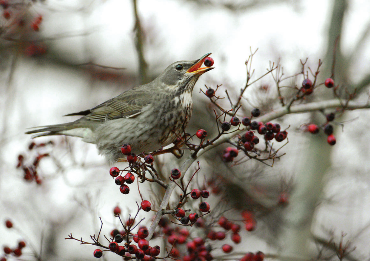
Sortstrubet drossel, 3K hun, Nivå, 20. november 2008.