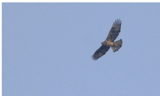
Høgeørn, 3K, Flagbakken, Skagen, 11. april 2008.