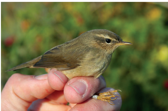
Brun Løvsanger, Hanstholm, 7. oktober 2008.

Der er i tre tilfælde tale om fugle med vingemål i overlappingsområdet mellem de to arter, og i et tilfælde (21/8 1971 Christiansø) er vingemål-data gået tabt.