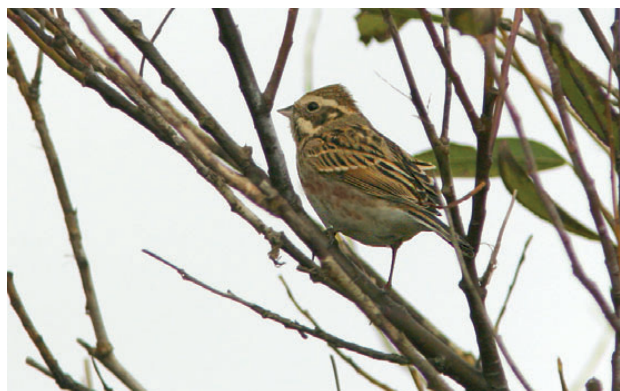
Pileværling, Roborghus, Tjæreborg, 19. september 2008.

Hermed syvende fund siden 2000. I perioden 1990 til 1999 blev der registreret 21 individer; altså en klar tilbagegang i forekomsten. Andet år i træk med fund fra Vestkysten (Kristensen et al. 2008); på Christiansø, der traditionelt har været Danmarks bedste lokalitet for arten, skal vi tilbage til 2004 for at finde seneste fund (Amstrup et al. 2005). (Nordlige Skandinavien, Finland og Rusland; overvintrer Kina og Sydøstasien.)