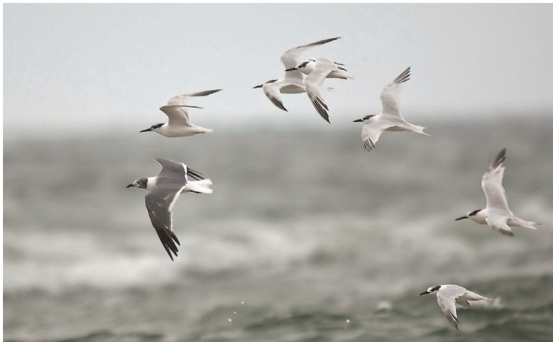
Littermåge, adult, Blåvands Huk, 26. august 2008.

E Arter der betragtes som undsluppet fra fangenskab eller på anden måde kun unaturligt har optrådt i landet, eller hvis fritlevende bestande – hvis eksisterende – formentlig ikke er selvsupplerende; fx Rødrygget Pelikan, Steppeørn med stropper og ynglefund af Mandarinand.