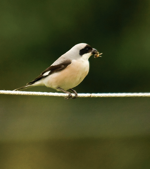
Rosenbrystet Tornskade, han, Lebøl, Als, 15. juli 2007.

Landets første Bjergløvsanger sp. (13/8 1966 Blåvands Huk) blev indsamlet, og skindet indgår i samlingen på Zoologisk Museum, København. I forbindelse med genbehandlingen er fire hidtil godkendte feltobservationer blevet forkastet: 10/5 1998 Klitmøller (NJ). – 5/5 1992 Jydelejet (M). – 15/5 1992 Måndø (RB). – 25/5 1982 Gudhjem (B). (Vestlig Bjergløvsanger: Sydvesteuropa, Centraleuropa, Nordafrika; overvintrer Vestafrika. Østlig Bjergløvsanger: Sydøsteuropa, Tyrkiet; overvintrer Østafrika.)