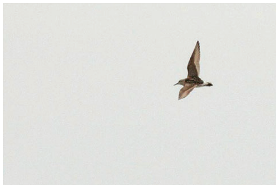
Hvidrygget Ryle, 2K+, Stauningsø, 15. juli 2008.

2008: 9/7, Galtkær (VE), ad. sdr., *Peder Nygaard Nielsen, Alex Sand Frich m.fl. (Foto). – 9-10/11, Råbjerg