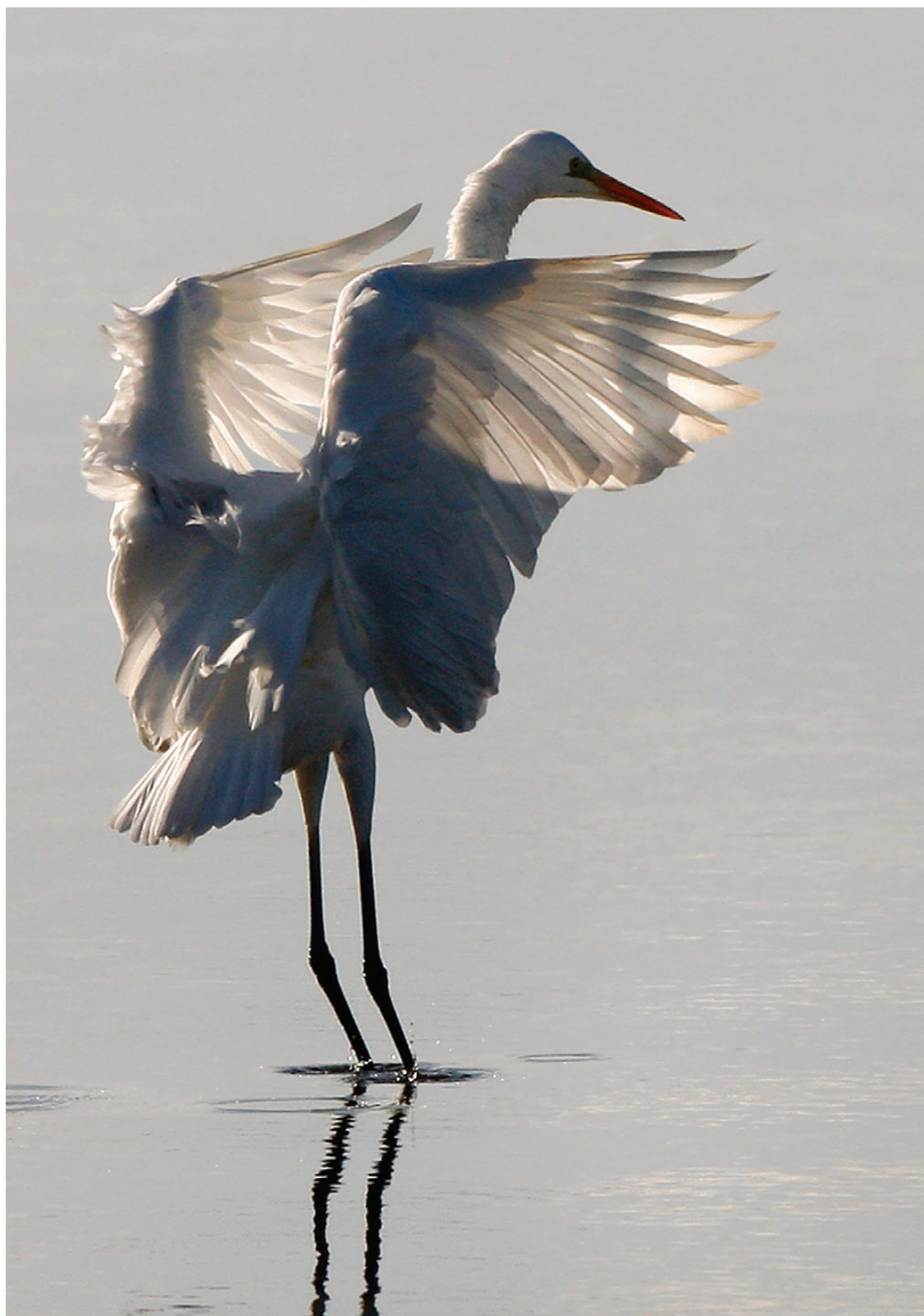
Sølvhejre, Østerild Fjord, 2. november 2008.