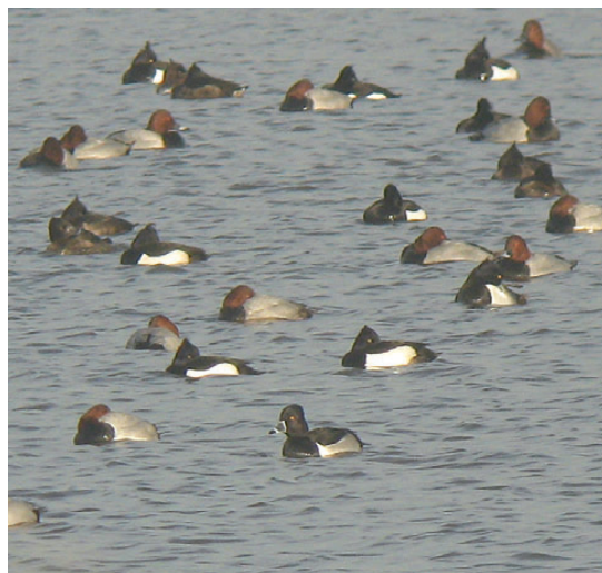
Halsbåndstroland, adult han, Skjern Enge, 10. februar 2008.

2008: 25/1-22/2, Lønborggård, Skjern Enge (RK), ad. han, *Ole Amstrup m.fl. (Foto). (Nordamerika)