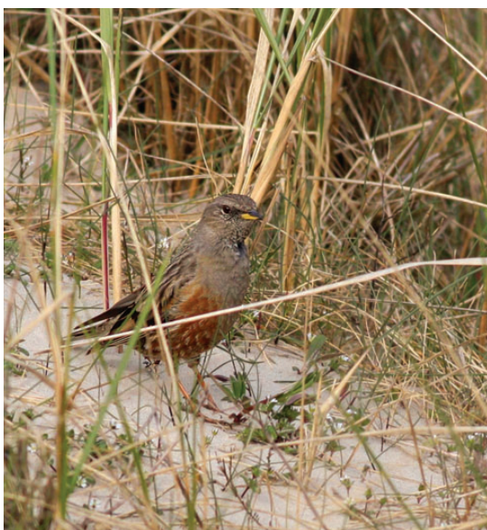
Alpejernspurv, Skagen, 30. april 2008.