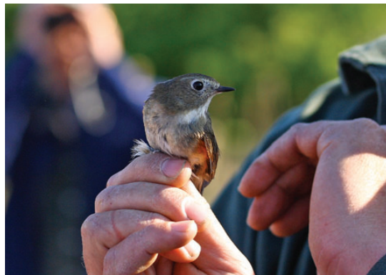
Blåstjert, 2K han/2K+ hun ringm., Ellekrattet, Skagen, 26. maj 2008.

2008: 30/4, Grenen, Skagen (NJ), trkf., *Rolf Christensen, Poul Thrane m.fl. (Foto). 11 af de danske fund er fra april og maj; eneste uden for denne periode er fra Christiansø 21-30/6 1990 (Frich & Nordbjærg 1992). (Alperne og Sydeuropa; overvintrer i østlige og sydlige Afrika.)