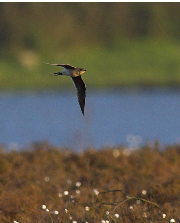
Rødvinget Braksvale, Bølling Sø, 21. maj 2008.