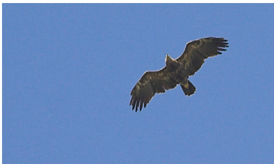
Lille Skrigeørn, 3K, Skagen, 5. juni 2008.