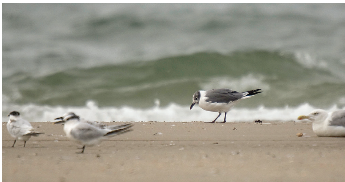
Lattermåge, adult, Blåvands Huk, 26. august 2008.

2008: 26/8, Blåvands Huk (RB), ad. odr., *Kirsten Hal-