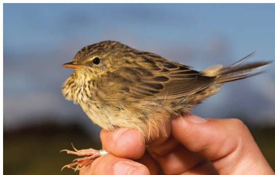
Stribet græshoppesanger, 1K, Skallingen, 17. oktober 2008.

2008: 17/10, Grønningen, Blåvand (RB), 1K ringm., *Torbjørn Eriksen, Jonas Gadgaard m.fl. (Foto). Første forekomst siden 2/10 2004, Christiansø (B) (Amstrup et al. 2005). Fuglen blev opdaget i felten og efterfølgende indfanget for at blive artsbestemt. Fundet er det hidtil seneste herhjemme. De øvrige 5 fund er fra 2-7/10. (Syd- og Centralsibirien til Nordøstkina og nordlige Japan; overvintrer i nordøstlige Indien og Sydøstasien.)