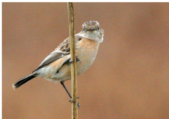
Sibirisk Sortstrubet Bynkefugl, 1K han, Hyllekrog, 20. november 2008. Foto: Klaus Malling Olsen

2008: 1/1-18/4 og 15/11-31/12, Nivå (S), 3K hun, Helge Sørensen m.fl. (Foto). Opsummeringen er ikke ændret, idet fuglen er en ganganger, der tidligere er set på lokaliteten i perioderne