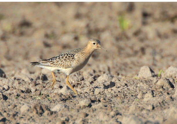
Prærieløber, 1K, Ulvedybet, 3. oktober 2008.

iagttagelser til og med 2008; seneste på Öland i august 2008 (endnu ikke publiceret) (Club 300 2009). (Nordostasien; overvintrer i Sydøstasien og Oceanien.)