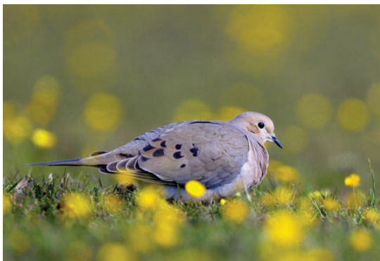
Sørgedue, 2K, Skagen, 20. maj 2008.

ste til dato (hidtil var 2 fund af i alt 5 fugle i 1992 bedste år (Frich & Nordbjærg 1994)). Arten har gennem de senere år ekspanderet mod nord og vest. I slutningen af 1990'erne etablerede den sig bl.a. i Vorpommern, i det nordøstlige Tyskland, hvor bestanden siden er vokset til flere hundrede par (Paul Vinke i brev). (Sydeuropa; overvintrer tropisk Afrika.)