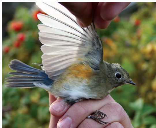
Blåstjert, 1K, Blåvand, 30. oktober 2008.

hænge sammen med, at arten er i fremgang på ynglepladserne i bl.a. Finland (Tarsiger.com 2009). Fuglen fra Blåvand er det seneste efterårsfund hidtil. Landets 11 fund fordeler sig med 3 om foråret (22/5-7/6) og 8 om efteråret (28/9-30/10). (Sibirien og fåtalligt Finland; overvintrer Nordindien og Østasien.)