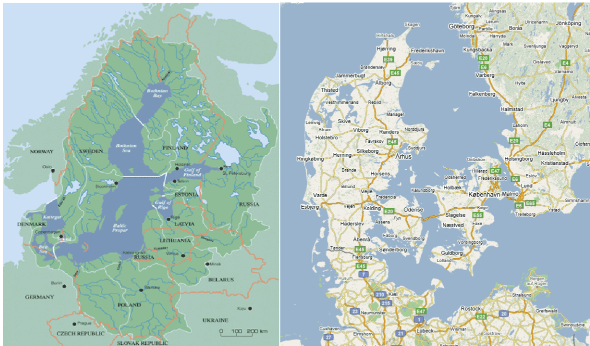
Figur 1. Gedser Odde's placering i forhold til Østersøen og Centraleuropa.