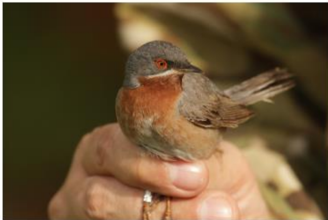
Hviolebbet sanger

Imponerende træk med flere hundrede tusinde brækende ederfugle, 15.000 rødstrubede lommer, 50.000 suler, og sjældne fugle som hviolebbet lom, sødfervet skræpe, rodnalset gås, amerikansk sortand og blåglente. Ringmærkning med fanget 10 - 15.000 fugle, hvor 3.000 fuglekonger og 2.000 rødhalze topper listen, som krydres med hviolebbet sanger og fuglekongesanger. Det er noget af det, en sæson ved en af DOF's fuglestationer kan byde på