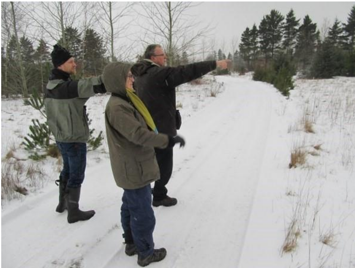
Konceptet for Vinter-TimeTælleTure afprøves i Vestjylland i februar 2014.