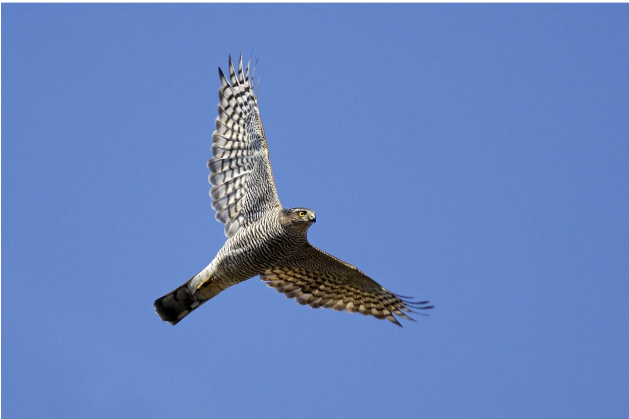
Spurvehøg hun.

Alt i alt en række flotte resultater, som DOF kun kan være særdeles tilfreds med.