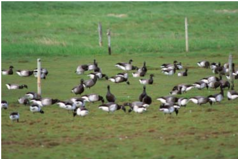
Sortbuget Knortegås ad., Agerø 16/5 2001 (fuglen i midten) i flok med Lysbugede og Mørkbugede Knortegæs.

Black Brant (center) with Dark-bellied and Light-bellied Brent Geese.