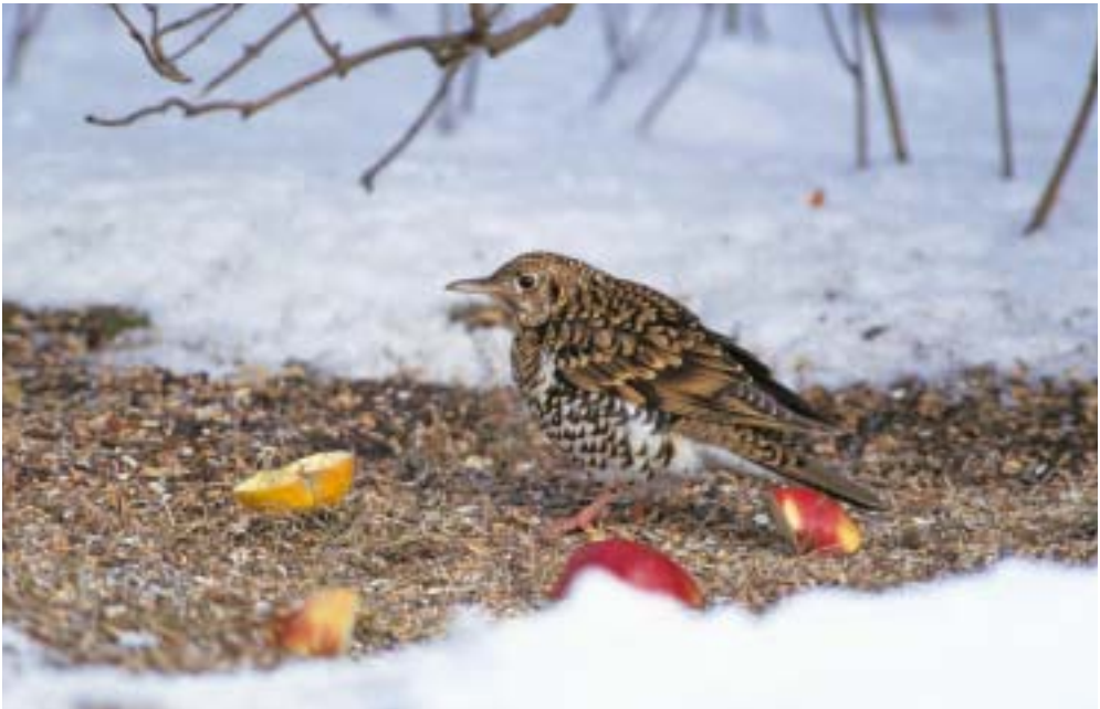
Gulddrossel 2K, Skårup, Øsløs 5/3 2001. White's Thrush.

Fuglen frekventerede en foderplads i en have under en kuldeperiode med snedække og forsvandt igen, da vejret slog om og sneen smeltede. Arten indleder forårstrækket i marts og ankommer til yngleområderne i maj, hvorfor det aktuelle fund må betragtes som en vinterforekomst. Alle hidtidige fund er af ældre dato: 10/4 1909 Liselund (M), 2/1 1918 Sjørring (NJ) og 13/10 1952 Nørresundby (NJ) (Salomonsen 1963, Rasmussen 1999). Med nu to vinterfund og ét fra hver træksæson adskiller forekomsten herhjemme sig fra billedet i det øvrige Nordvesteuropa, hvor efterårsfund dominerer. Blandt andet har Sverige 6 fund september-november 1837-1985 (Risberg 1990) og Finland 3 fund 29/9-5/10 1961-1999 ( www.birdlife.fi ). (Sibirien mod vest til Ural; overvintrer Indien og Sydøstasien)