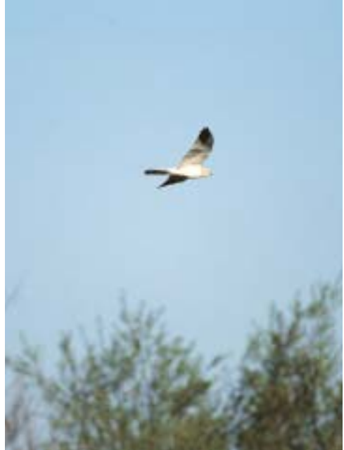
Steppehøg 3K+ ♂, Rejsby Enge 12/5 2001.