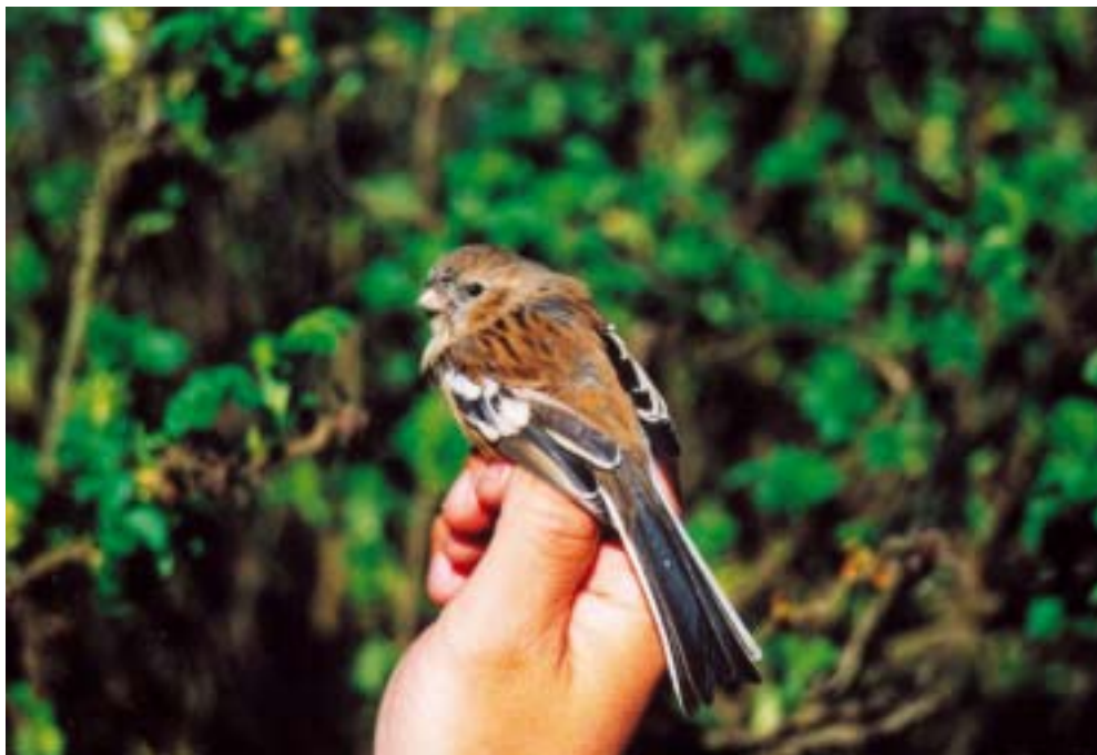
Langhalet Karmindompap 2K+ ♀, Blåvand 11/5 2001. Long-tailed Rosefinch.

Krumnæbbet Ryle Calidris ferruginea 2001: 6.12, Vester Vedsted Sluse (RB), *Michael Schwalbe.