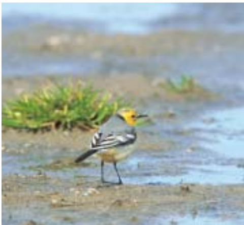
Citronvipstjert 2K ♂, Værnengene 1/5 2001. Citrine Wagtail.

Landets andet fund af Gråsejler og den første fugl observeret og bestemt i felten. Arten var hidtil blot repræsenteret med en dødfunden fugl 11/3 1993 Kirke Helsing (S) (Nielsen & Thorup 2001, Thorup 2001). Den aktuelle fugl dukkede op i forbindelse med en relativ varm luftstrøm fra det sydvestlige Middelhav og udgør det nordligste fund under en invasion til Nordvesteuropa i oktober 2001. Således havde Storbritannien 9 fund 2-31/10 (Colin Bradshaw i brev) og Nordfrankrig 1 eks. 20/10 og 24/10 (Phillippe J. Dubois i brev).