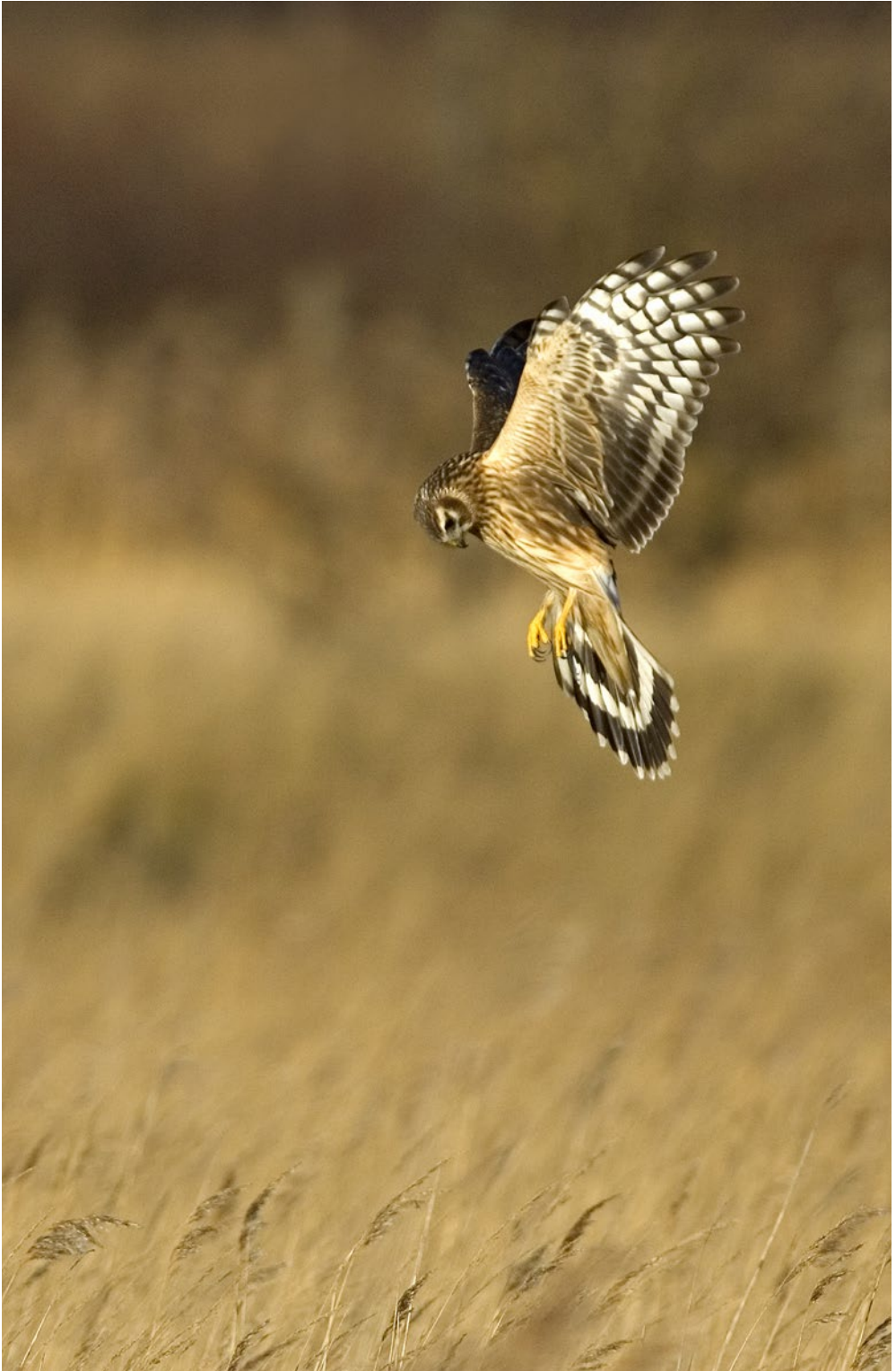
Med op til 17 individer er den Blå Kærhøg den talrigste rovfugl på Tipperne i vinterhalvåret.