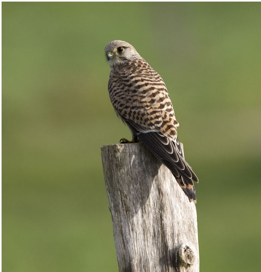
Antallet af Tärnfalke på Tipperne kulminerer i sensommeren, når voksne og unge fugle fra nabolagets ynglebestand dukker op i løbet af juli og i august.

gangen på Tipperne, end at bestandene i Norge og Sverige – som de danske trækfugle kommer fra (Bønløkke et al. 2006) – rent faktisk er gået frem.